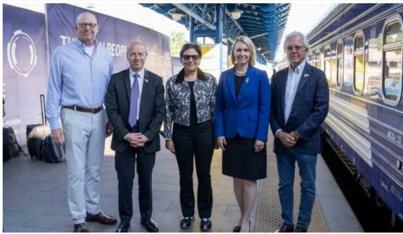
До Києва з візитом прибула спецпредставниця США Пріцкер

До Києва з візитом прийшли спеціальна представниця США з питань економічного відновлення України Пенні Пріцкер та керівники американських компаній Amentum, Clayo Inc та WestingHouse Nuclear.