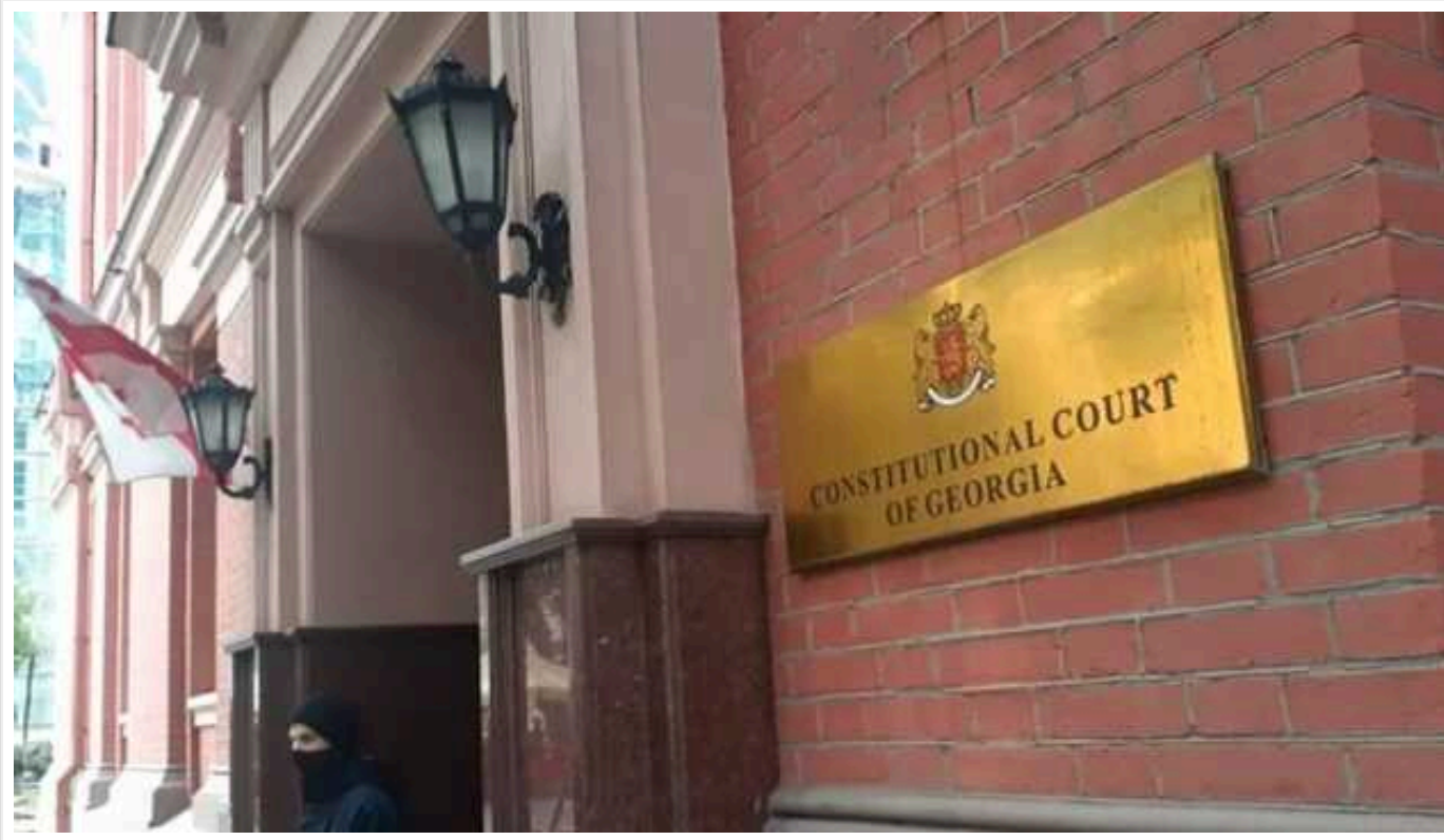
У Грузії до Конституційного суду подали вже третій позов щодо закону про «іноагентів»

Парламентська опозиція звернулася до Конституційного суду Грузії з проханням призупинити дію суперечливого закону «Про прозорість іноземного впливу».