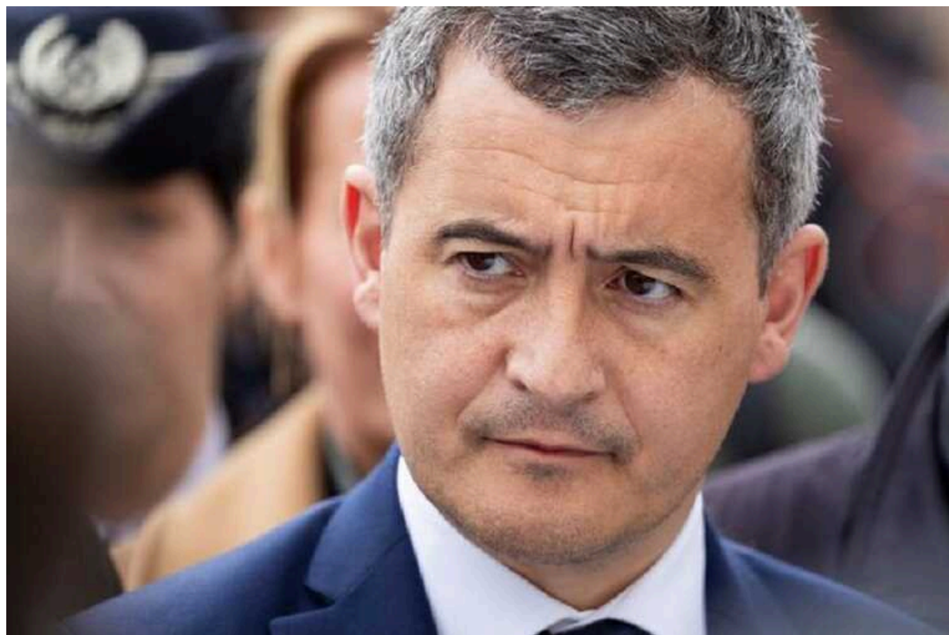
Невідомі відправили голові МВС Франції Жеральду Дарманену лист із чумою, - Parisien

До Міністерства закордонних справ Франції надіслали лист із вірусом чуми. Його адресували голові відомства Жеральду Дарманену.