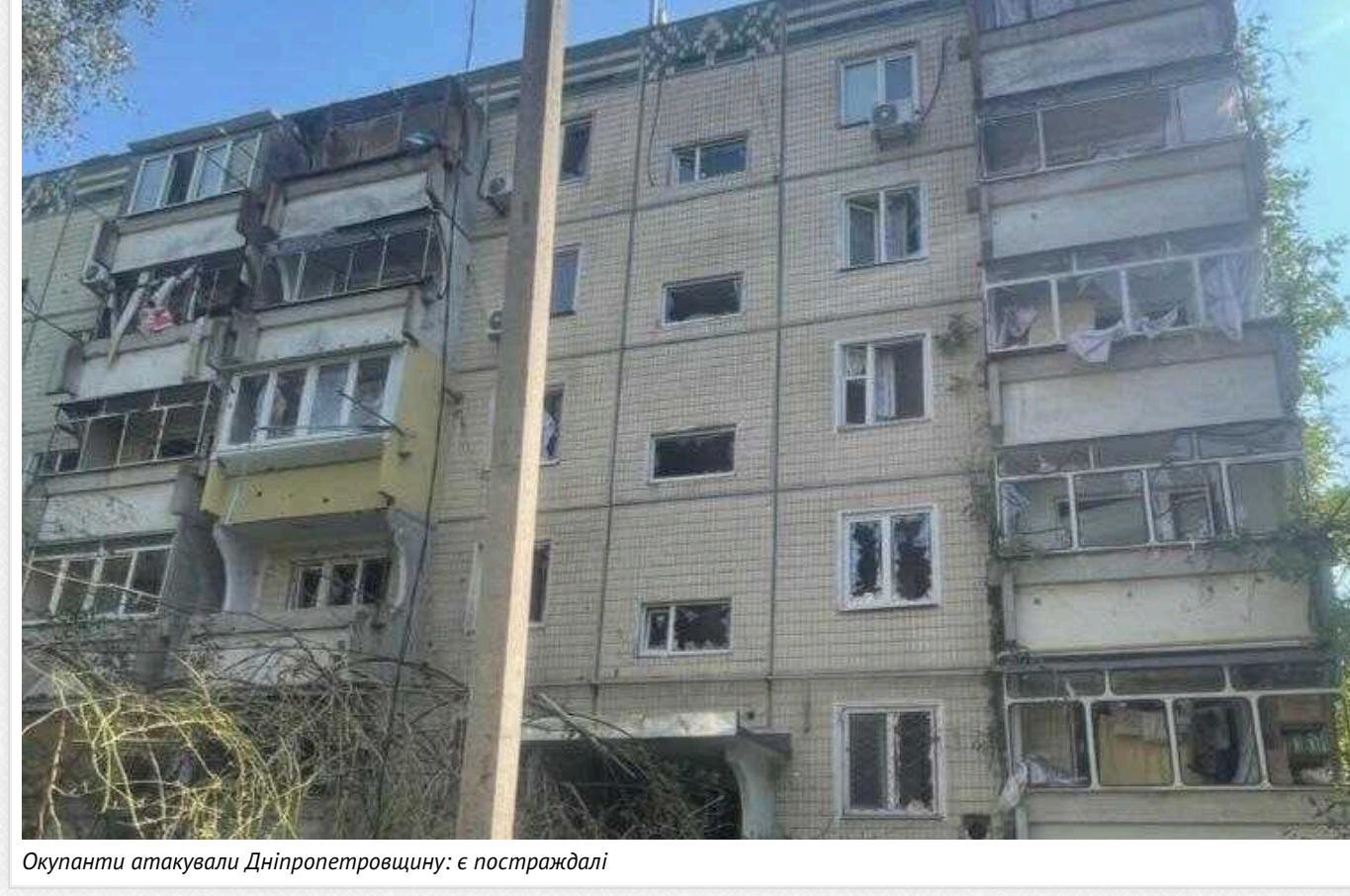
Окупанти атакували Дніпропетровщину: є постраждалі

Під ударами військ країни-агресора у неділю, 28 липня, опинилися два райони Дніпропетровщини - Нікопольський та Криворізький. Унаслідок атак є постраждалі.