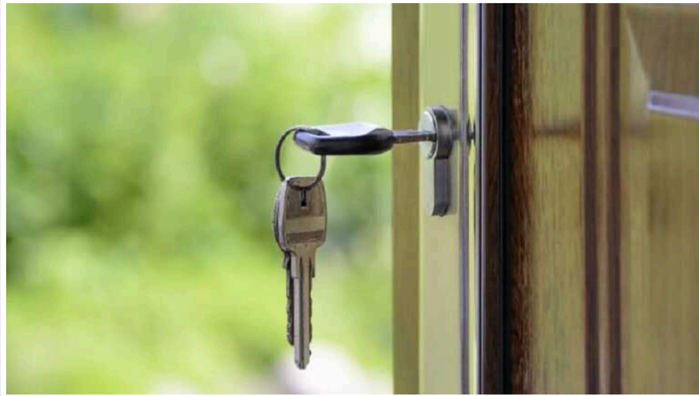
У ЗМІ розповіли, як квартирні аферисти відбирають житло

Власне житло у багатьох людей асоціюється з безпекою, зашишком та комфортом. Однак, втратити все це легше ніж здається – квартирні аферисти нікуди не поділяся. Жертвами квартирних шахраїв найчастіше стають самотні люди, пенсіонери, інваліди, алко- та наркозалежні або ж ті, хто залишив свою домієку без нагляду на довгий період. Відібрати квартиру у таких людей зловмисникам найлегше.