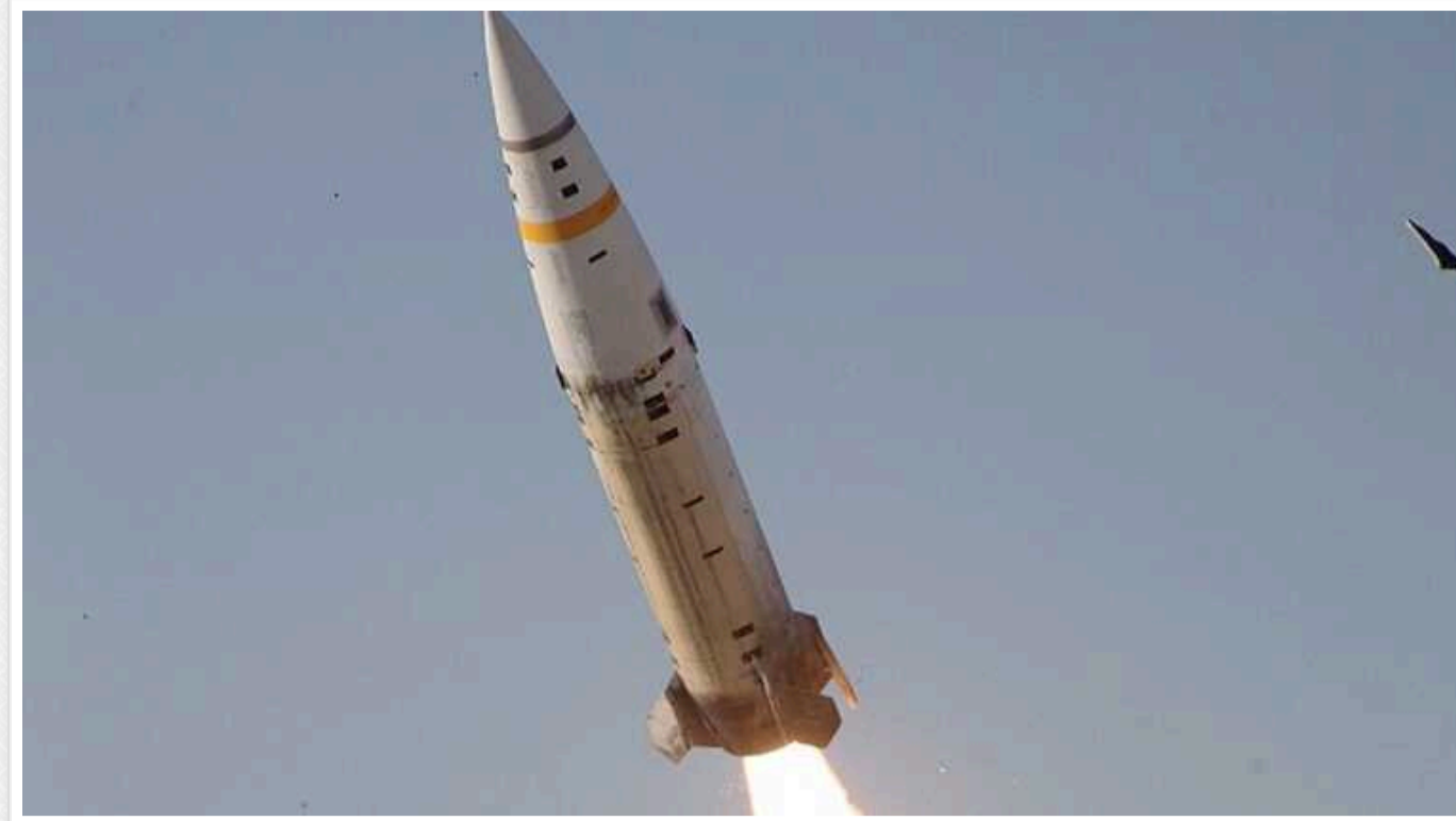
ЗСУ завдали удару по полігону РФ на окупованій Луганщині

На тимчасово окупованій території Луганської області 27 липня був пріліт по тиловому військовому полігону російських загарбників. У ворога внаслідок цього значні втрати в особовому складі – близько 90 окупантів стали "двохсотими" або "трисотими".