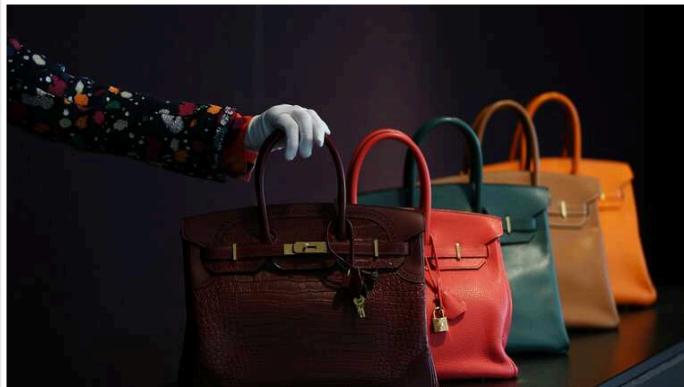
У швидкісному поїзді з Ніцци до Парижа у невістки глави держави Катар мігранти вкрали 11 люксових сумок Hermès

У невістки глави держави Катар мігранти вкрали 11 люксових сумок Hermès у швидкісному поїзді з Ніцци до Парижа.