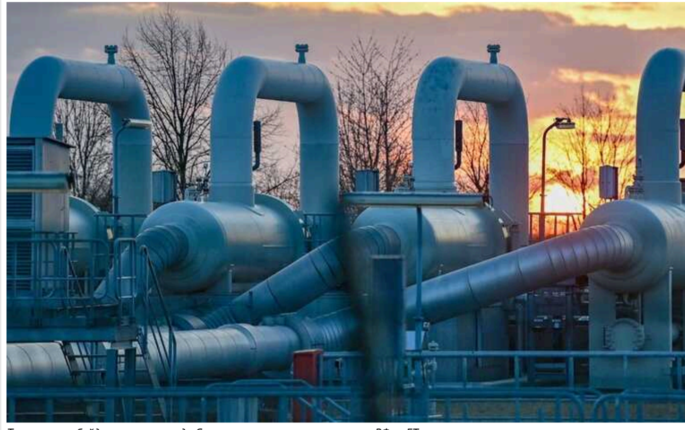
Транзит азербайджанського газу до Європи може стати прикриттям РФ, – FT

Заміна російського газу азербайджанським для транзиту в Європу може бути пасткою Кремля.