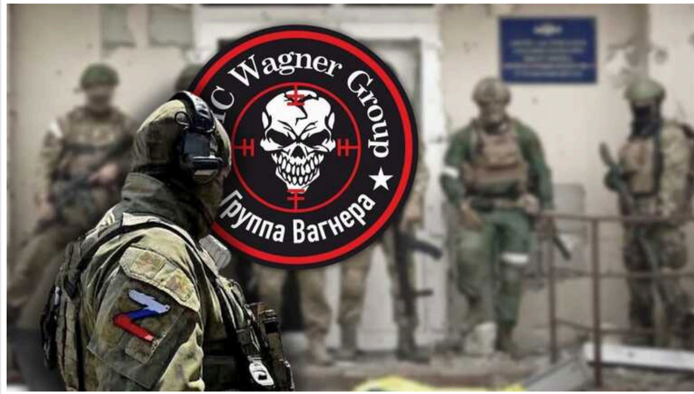
Найпопулярнішого пропагандиста ПВК "Вагнер" ліквідовано в Малі, - росЗМІ

Десятки росіян із ПВК "Вагнер" було вбито або взято в полон на півночі Малі. В ході боїв також ліквідовано пропагандиста найманців, автора каналу Grey Zone.