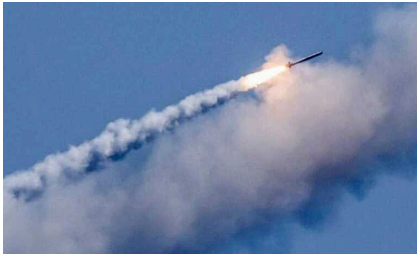
Окупанти завдали ракетних ударів по одному з транспортних підприємств Харкова