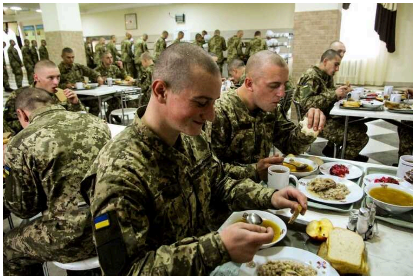
У Миколаєві начальницю військової їдальні покарали штрафом за безпідставне списання харчів на 2,65 мільйона гривень

У Миколаєві ДБР розслідувало справу №4202315241000062 щодо можливого недбалого ставлення до військової служби, в рамках якої виявилось, що посадовці неправильно зберігали продукти харчування й вели облік продовольства, що завдало державі значної шкоди.