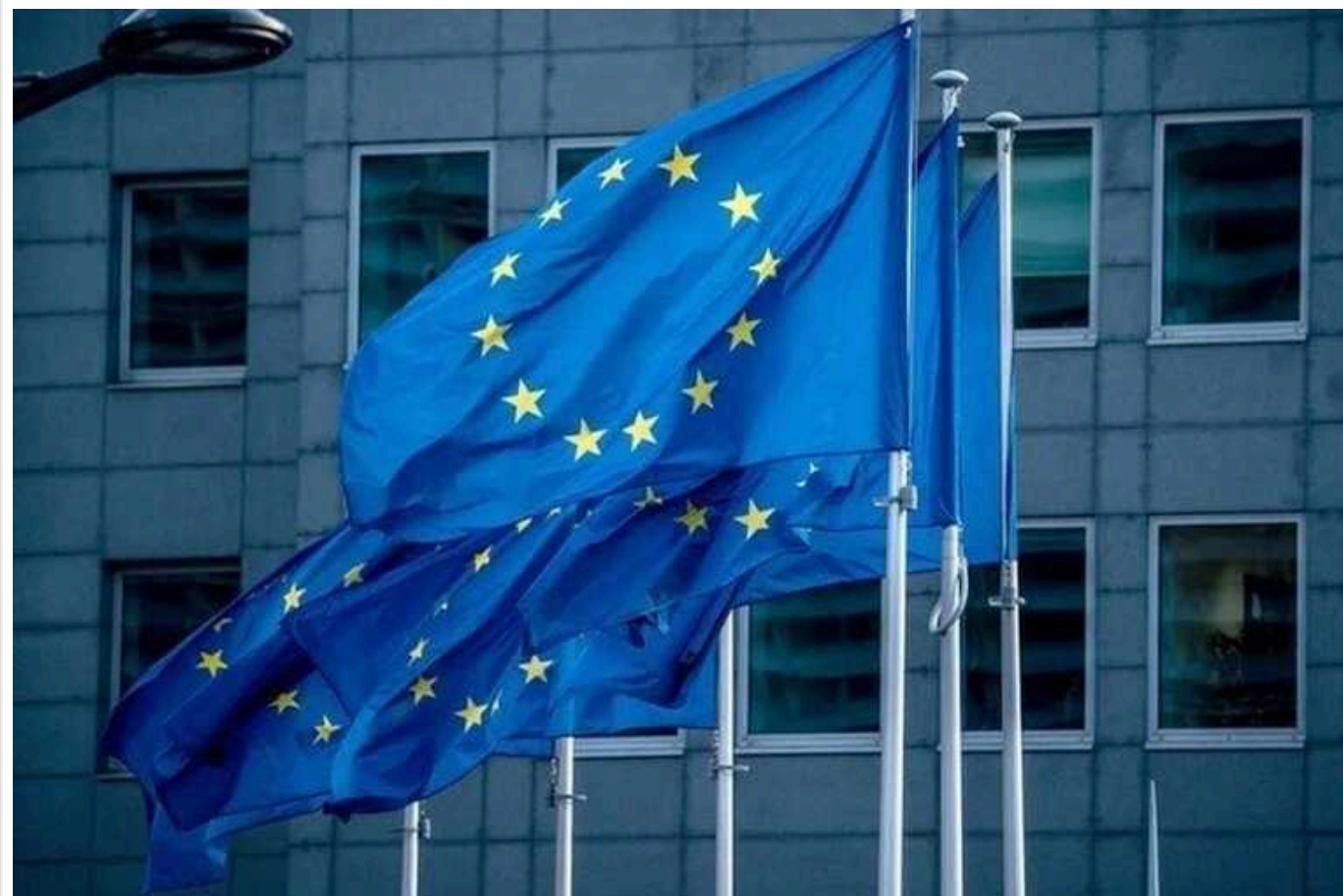
Дипломатична служба ЄС запроваджує заходи економії через урізаний бюджет, - FT

Дипломатам Європейського Союзу сказали відмовитися від запланованих поїздок, скасувати вечірки та відкласти роботу щодо посилення безпеки їхніх резиденцій - через перевищення бюджету Європейської служби зовнішніх справ, зовнішньополітичного відомства ЄС.