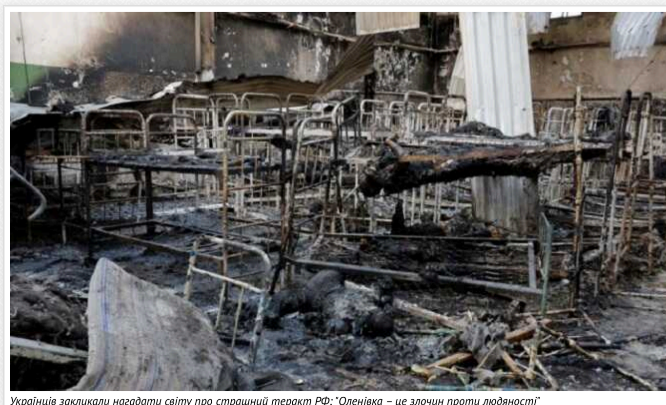
Українці закликали нагадати світу про страшний теракт РФ: "Оленівка – це злочин проти людяності"

У ніч з 28 на 29 липня 2022 року російські окупанти скоїли тяжкий воєнний злочин: вони підірвали барак у колонії в Оленівці Донецької області, де утримували полонених воїнів з полку "Азов". Тоді загинули 54 захисники Маріуполя, понад 130 військовополонених "азовців" зазнали поранень.