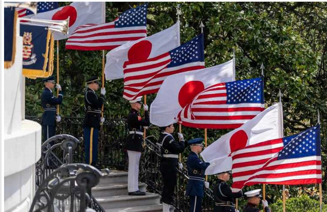
WSJ: Сполучені Штати створюють військове командування в Японії для протидії Китаю

Нове командування координуватиме військові дії з японськими силами, плануватиме спільні навчання та братиме участь в обороні країни під час військових конфліктів.