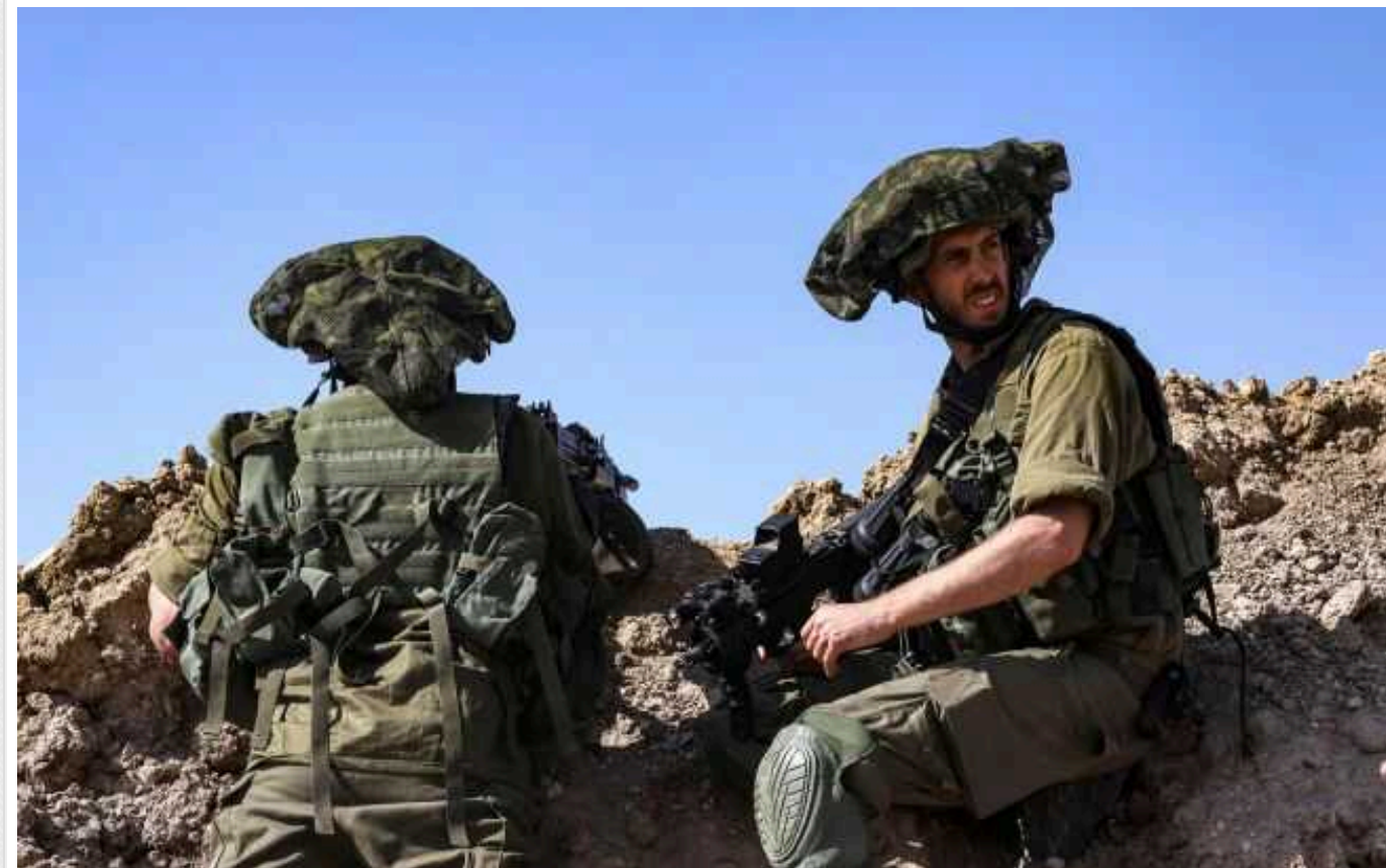
Ізраїль попередив Ліван про загрозу «руйнівній війні» після обстрілу стадіону на Голанських висотах

В Ізраїлі заявили, що умовою для уникнення війни є роззброєння та відведення сил "Хезболли".