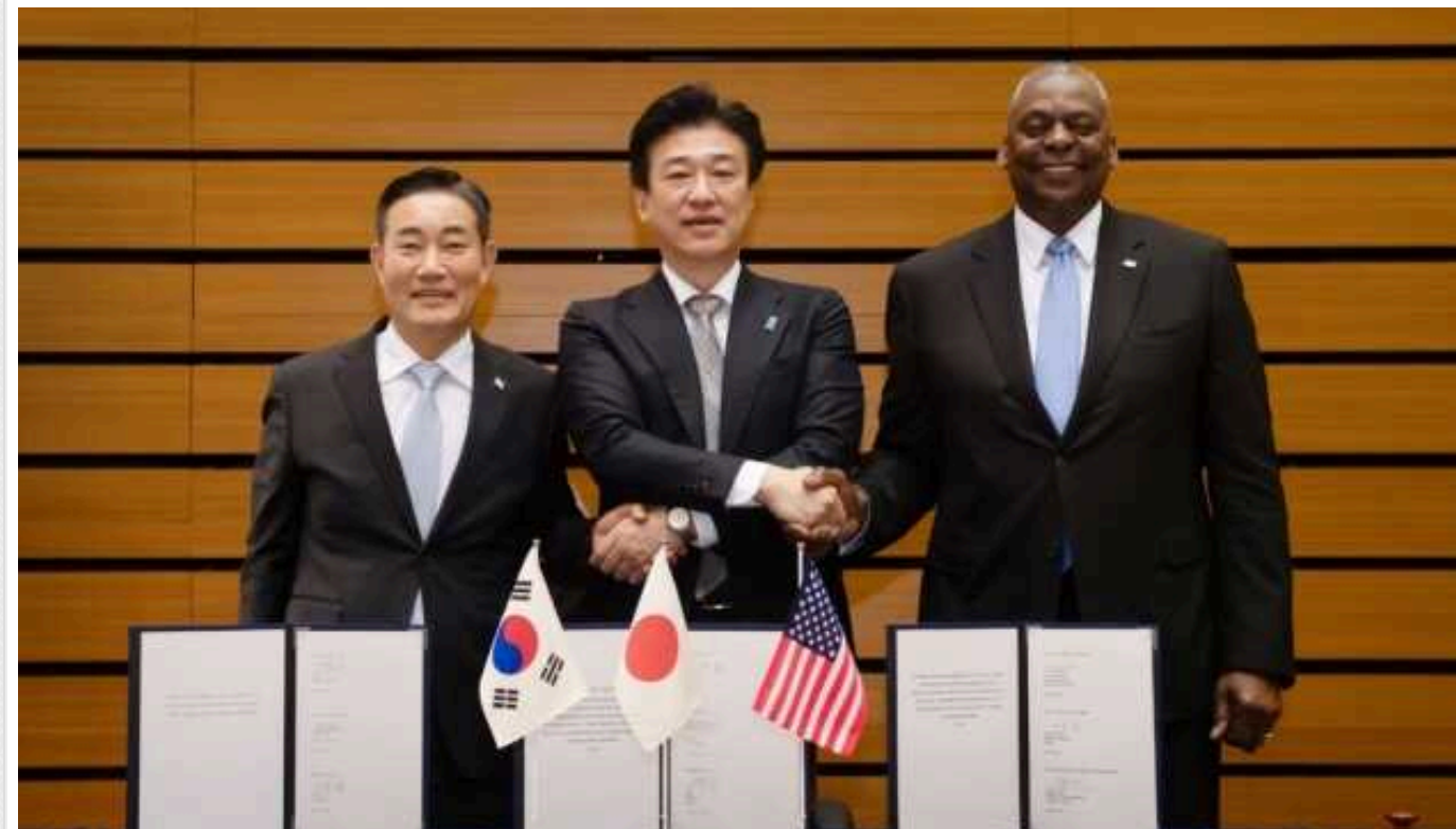
Сполучені Штати, Японія і Південна Корея підписали меморандум про співпрацю у безпековій сфері

Міністри оборони США, Японії та Південної Кореї підписали в неділю документ про тристоронню співпрацю у сфері безпеки.