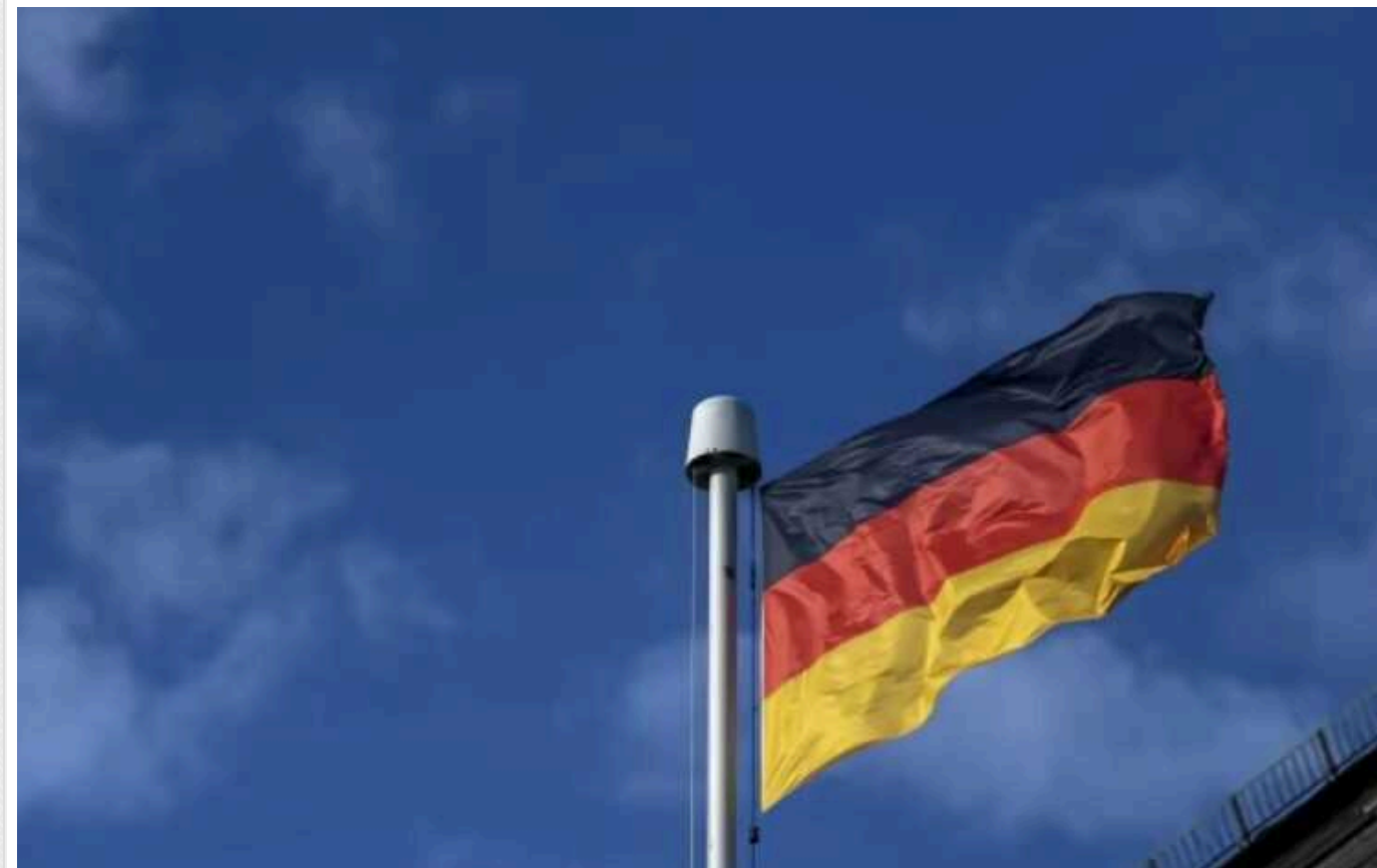
У Німеччині українці, які не працюють, можуть втратити державну допомогу

Генеральний секретар найбільшої опозиційної німецької партії Християнсько-демократичний союз (ХДС) Карстен Ліннеманн виступає за необхідність скасування державної допомоги для непрацевлаштованих, зокрема українських біженців.