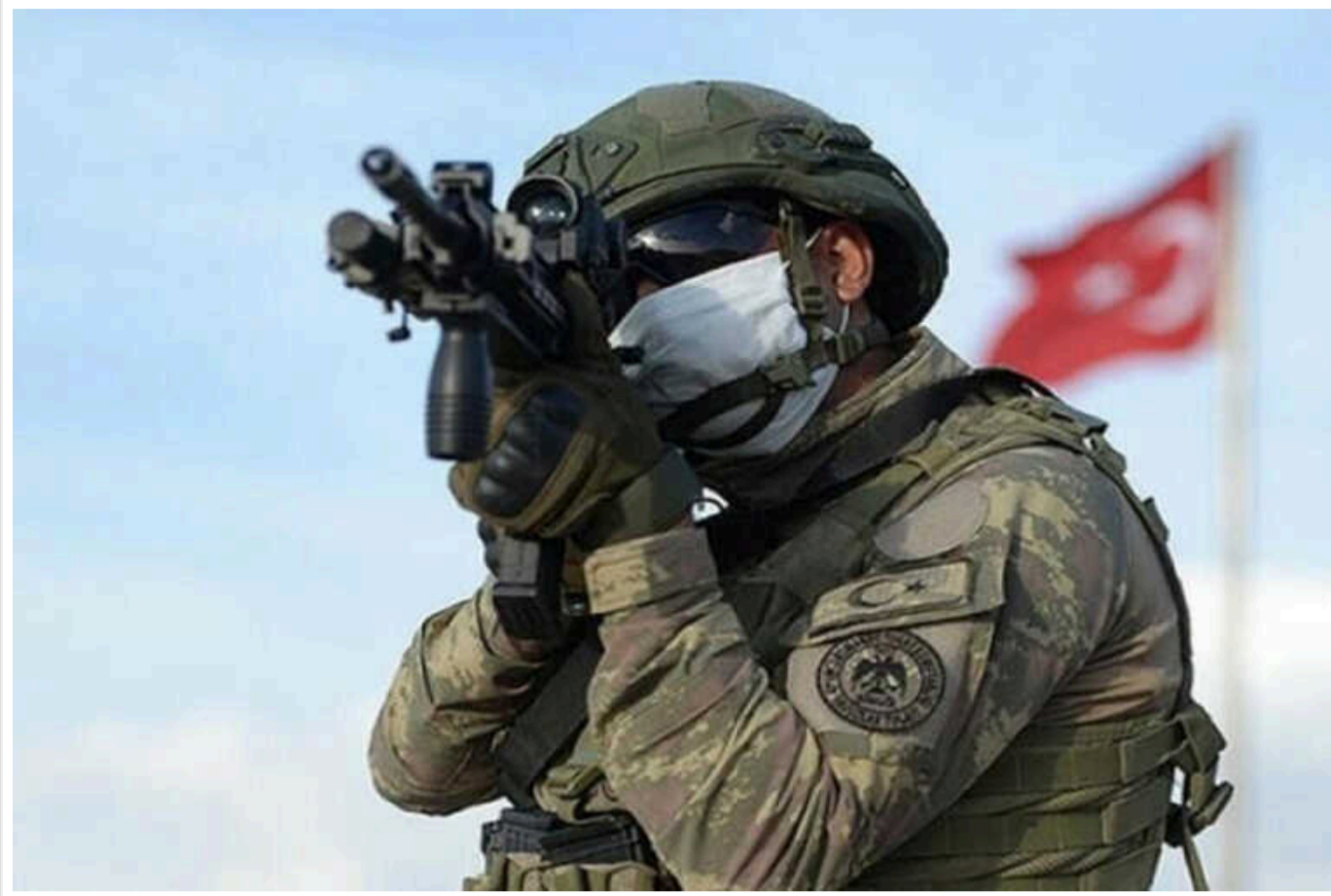
ЗС Туреччини залишатимуться в Сомалі ще 2 роки

Генеральна асамблея Великих національних зборів (парламенту) Туреччини позитивно розглянула дворічне продовження перебування підрозділів ЗС Туреччини в Сомалі.