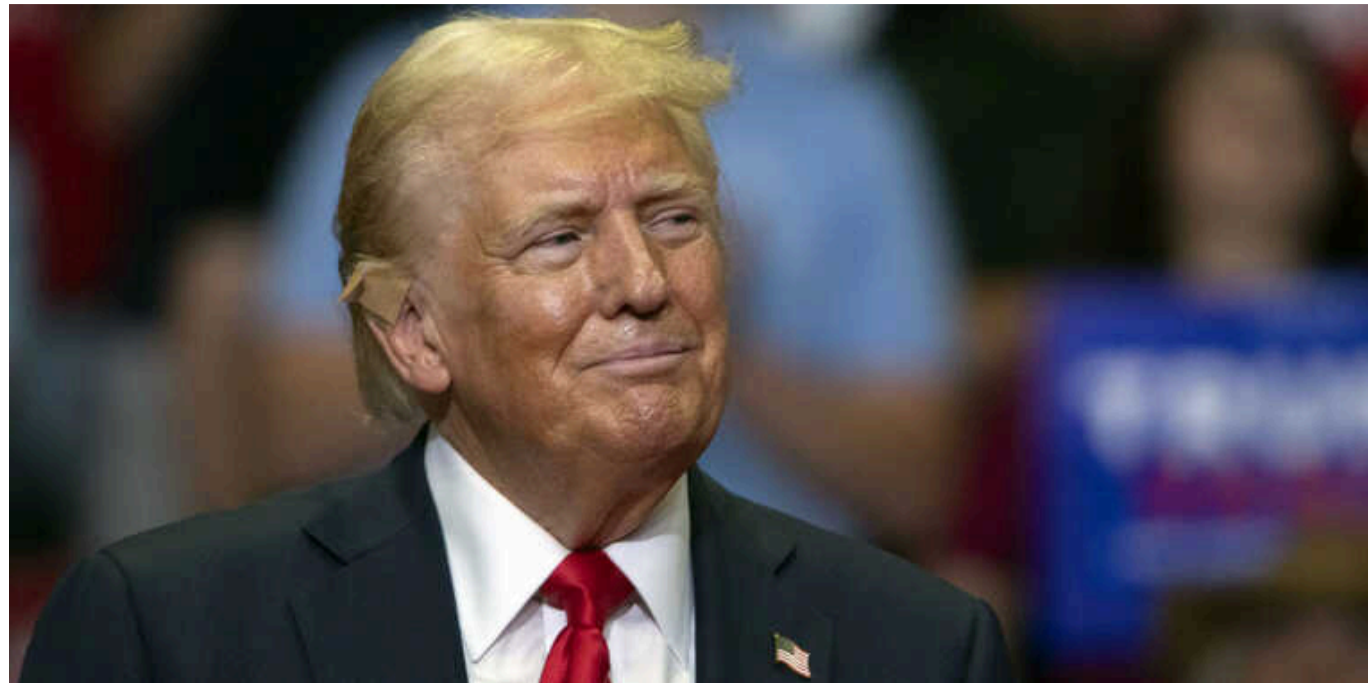
Politico: Трамп хоче заручитися підтримкою прихильників криптовалют

Кандидат у президенти США Дональд Трамп розкритикував віцепрезидентку Камалу Гарріс за підхід адміністрації Байдена до регулювання криптовалют і пообіцяв сприяння прихильникам біткоїна.