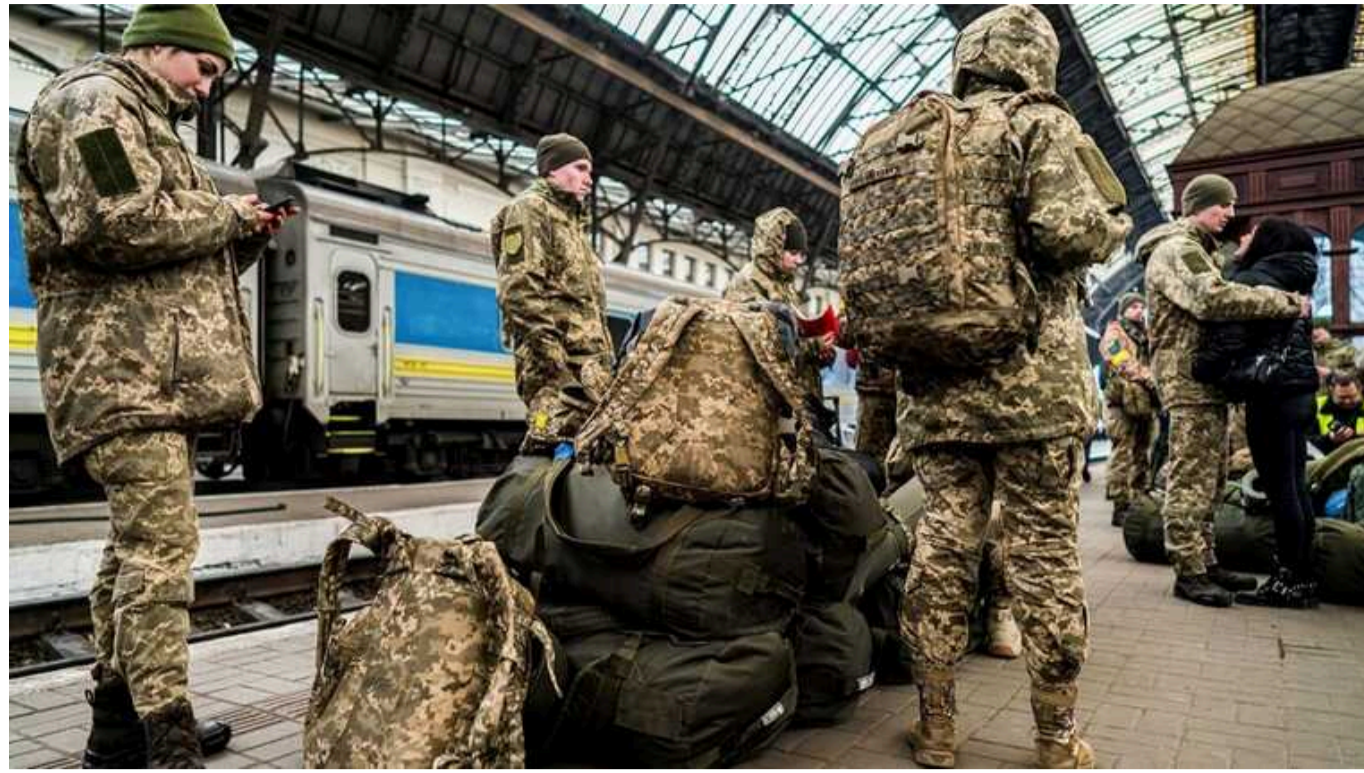
Міноборони: Поява закону про демобілізацію залежить від ситуації на фронті, темпів мобілізації та постачання зброї

Поява закону про демобілізацію залежить від багатьох факторів, зокрема, ситуації на фронті, темпів мобілізації та постачання зброї.