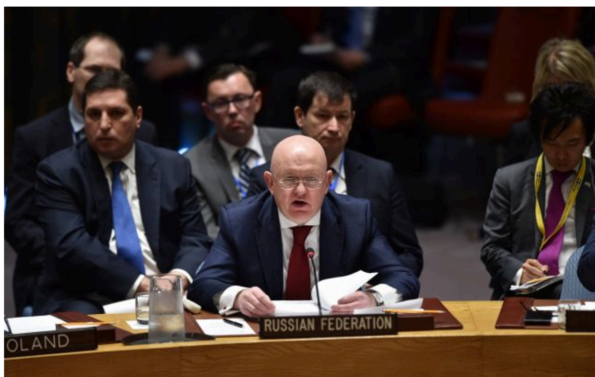
Фото: посол РФ в ООН Василь Небензя (Getty Images)

Розумій ситуацію на фронті через факти, а не чутки з РБК-Україна у Google