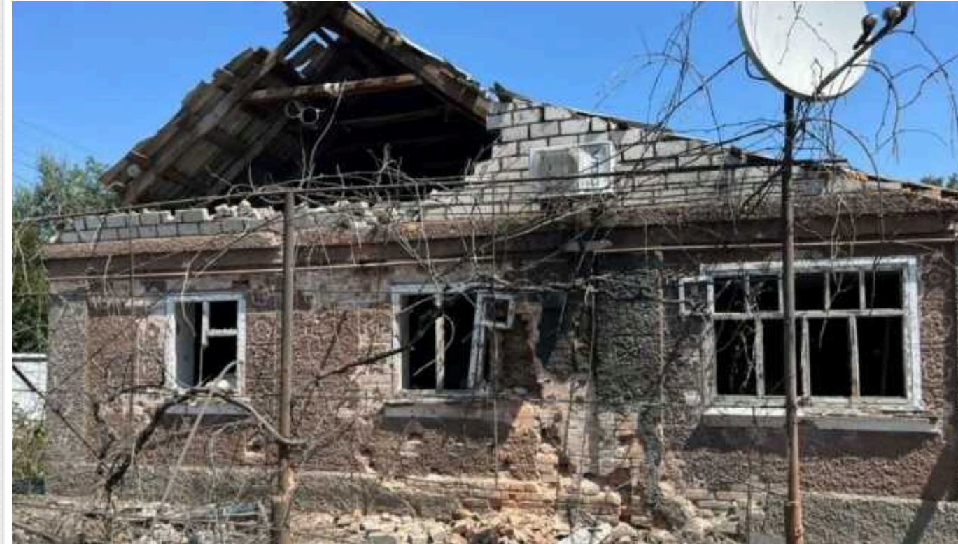
Окупанти завдали удару дронами та обстріляли з артилерії Нікопольський район: є пошкодження

Унаслідок обстрілів дронами та з артилерії Нікополя, Червоногригорівської, Мирівської та Покровської громади на Дніпропетровщині у суботу пошкоджені приватні будинки, господарські споруди та сонячні панелі.