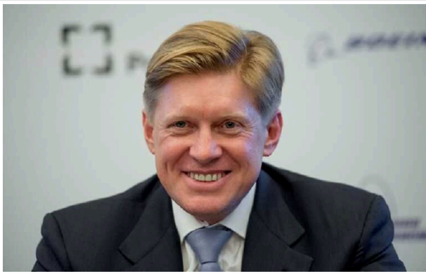
Російський олігарх Михайло Шелков таємно постачав Росії український титан для виробництва ракет

В Україні оголосили про нову підозру підсанкційному російському олігарху, мільярдеру Михайлу Шелкову. Його підозрюють в організації постачання стратегічної продукції з України на збройні підприємства в РФ. "Роботу" Шелкова та його спільників нині розглядають як фінансування дій, що несуть загрозу конституційному ладу та територіальній цілісності України.