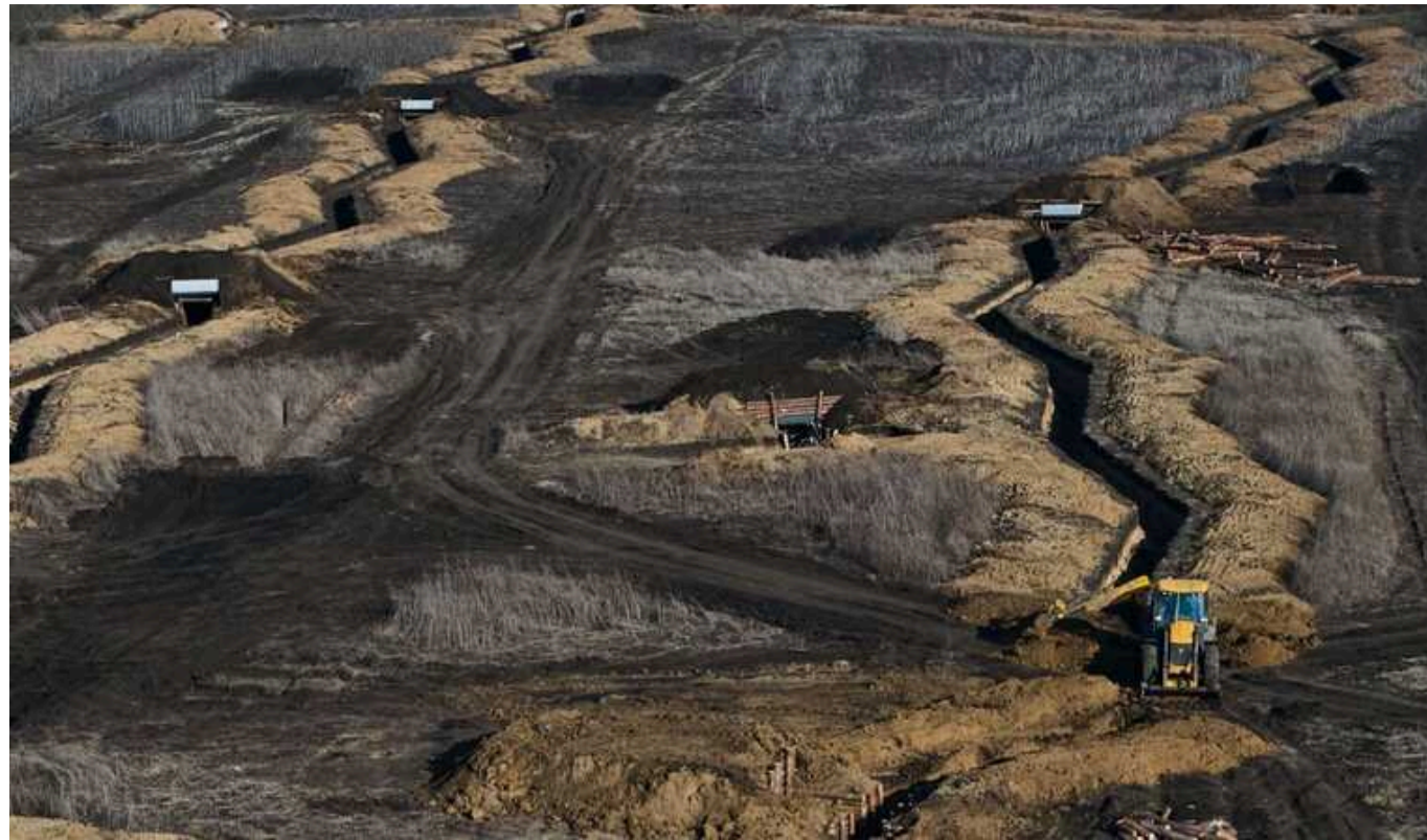
У Резервному фонді, з якого фінансують термінову відбудову та фортифікації, залишилося тільки 592 мільйони гривень

У Резервному фонді держбюджета, з якого уряд виділяє кошти на термінові потреби відбудови та фортифікації, залишилося всього 592 млн гривень з 56 млрд грн передбачених на 2024 рік.