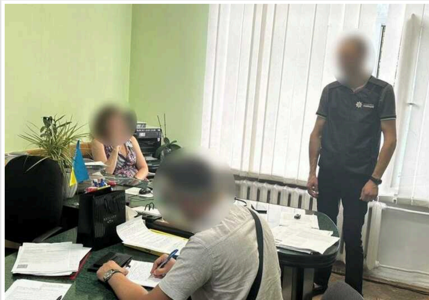
У Тернопільській області чиновниця отримувала хабарі у вигляді подарункових сертифікатів мережевого магазину та на відпочинок в готелі

Чиновниця з Кременця отримувала хабарі у вигляді сертифікатів мережі косметики та парфумерії Brosard та на відпочинок в готелі. Депутатка міської ради спільно із заступником голови Кременця, старостою однієї з громад і директором комунального підприємства організували злочинну схему на оренді комунального майна.