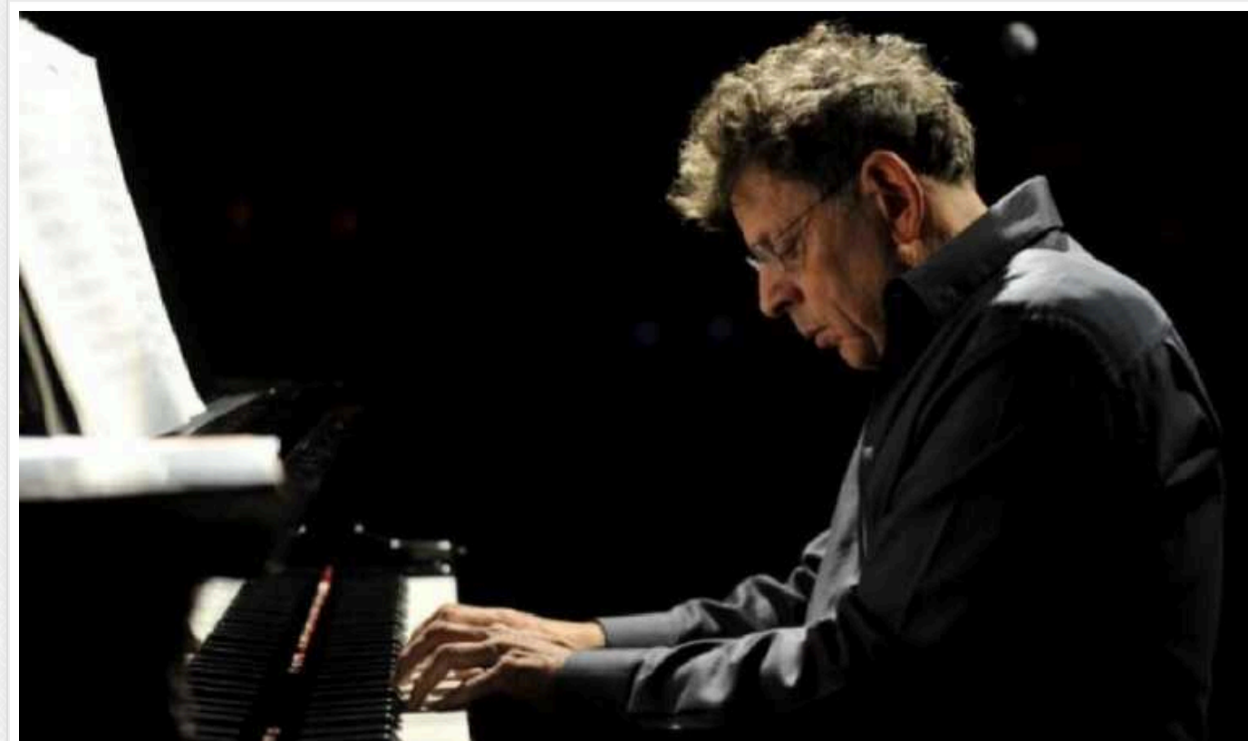
Театр в окупованому Севастополі вкрав музику американського композитора Філіпа Гласса: маестро різко відреагував

Американський композитор Філіп Гласс звернувся до Севастопольського театру опери та балету в тимчасово окупованому Росією Криму з проханням не використовувати його музичні твори. Там наступного тижня заплановано прем'єру балету "Грозвий перевал" на музику американця.