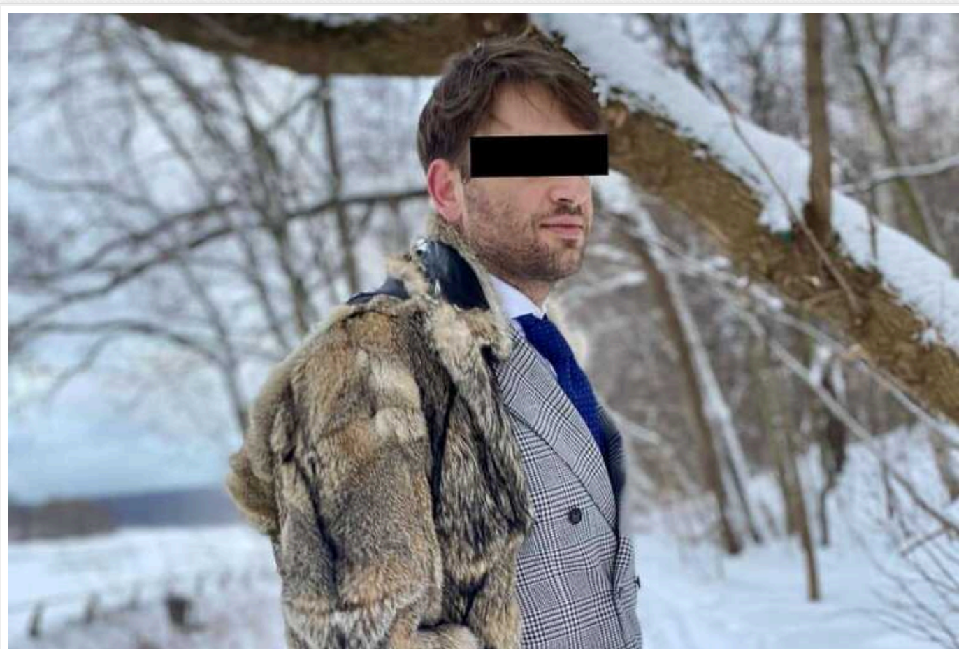
У Парижі спіймали російського кухаря, який працював на ФСБ

У столиці Франції затримано громадянина Російської Федерації за підозрою у спробі зриву відкриття Олімпіади – завдання він отримав від ФСБ.