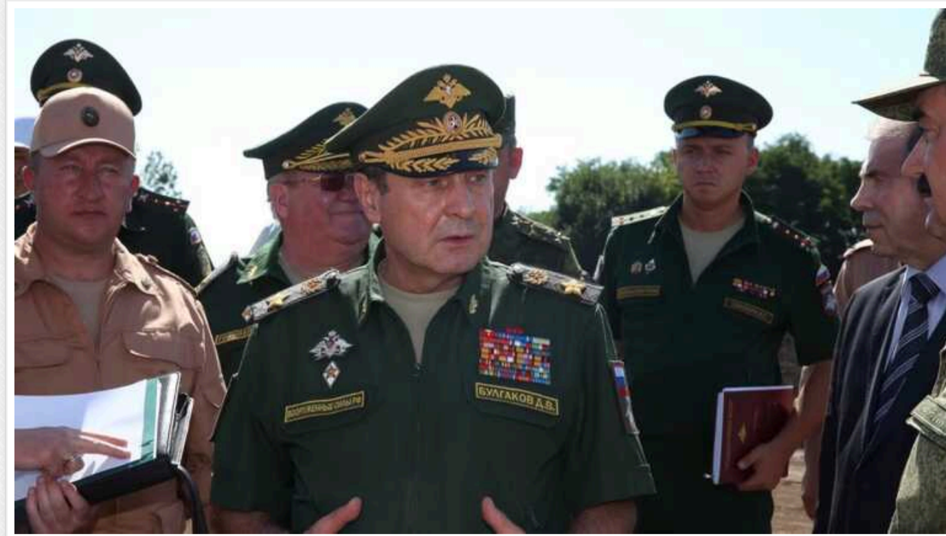
У Росії за корупцію затримали колишнього заступника Шойгу Дмитра Булгакова

ФСБ Росії заарештувала колишнього заступника міністра оборони РФ, генерала армії Дмитра Булгакова у справі про корупцію.