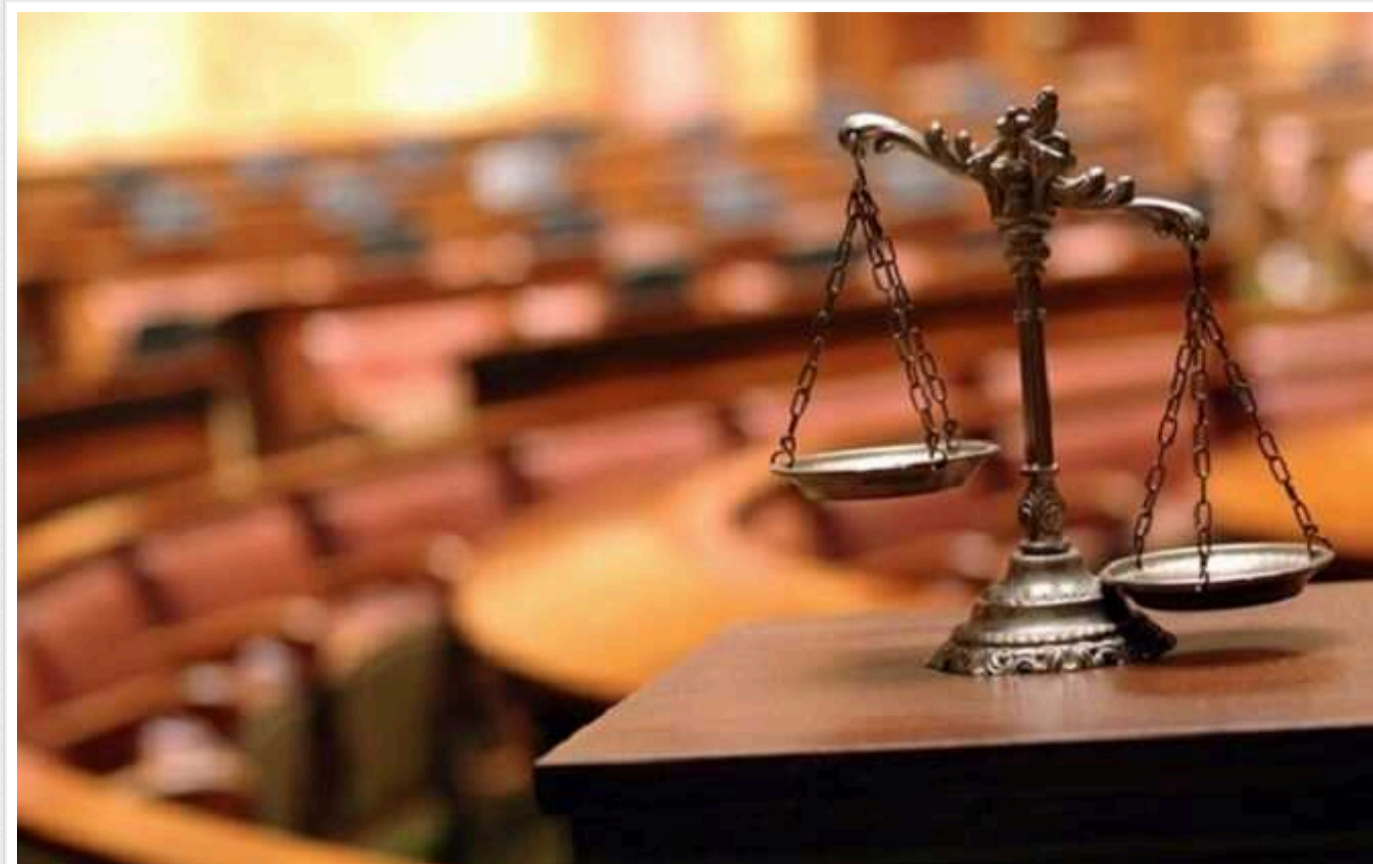
Винуватця аварії, в якій загинула працівниця рівненського ТЦК, залишили в СІЗО

Апеляційний суд відхилив вимоги 41-річного підозрюваного та його захисника про зміну запобіжного заходу на цілодобовий домашній арешт із носінням електронного браслета.