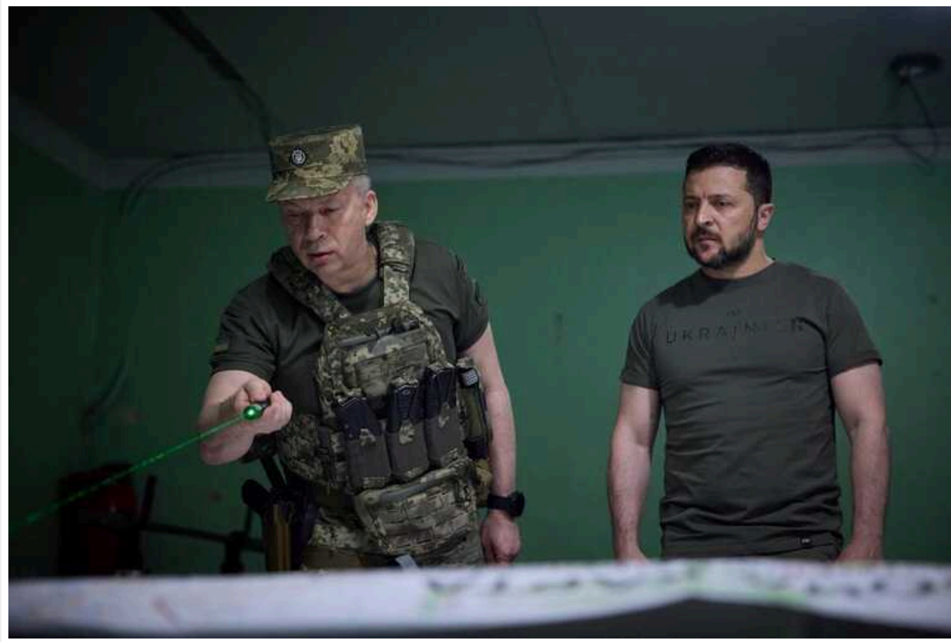
Головом Сирський відзначає 59-й день народження