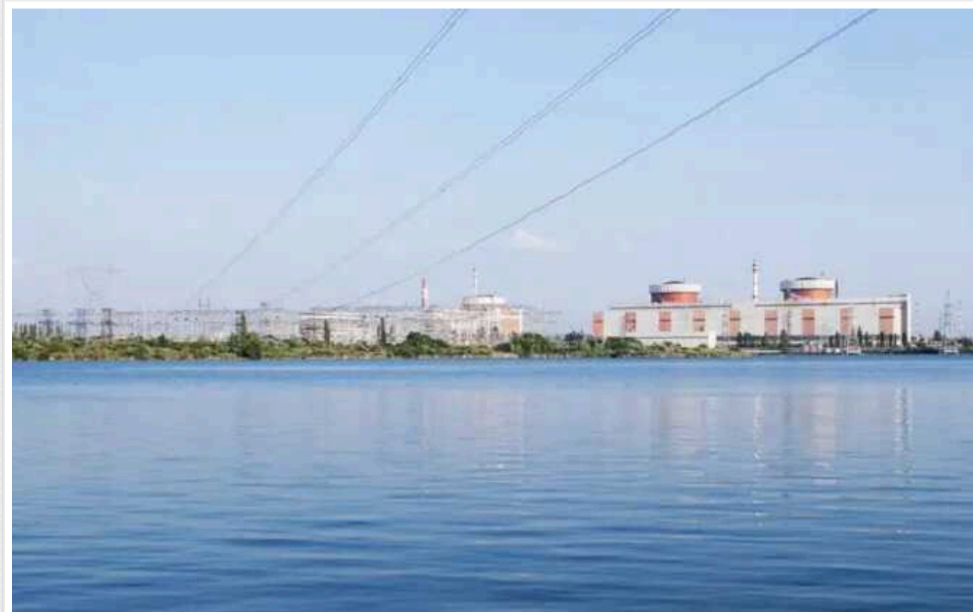
МАГАТЕ підтвердило НП із трансформатором на Південноукраїнській АЕС

Генеральний директор МАГАТЕ Рафаель Гроссі підтвердив, що з трансформатором на Південноукраїнській АЕС сталася НП. Інцидент трапився минулого тижня.