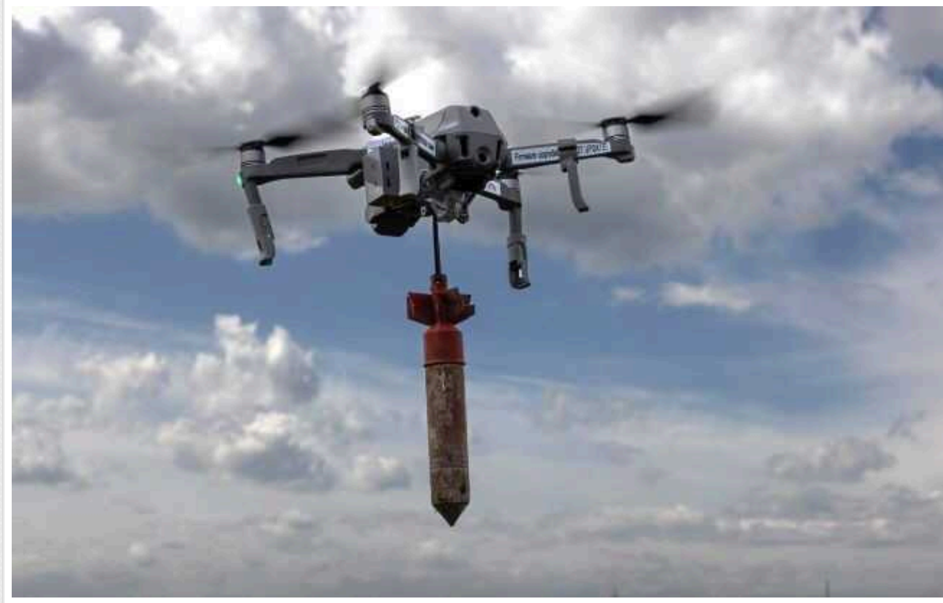
Після атаки БПЛА в Ніжині різко зросло число поранених

Під удар потрапив гуртожиток, в якому переважно проживали люди пенсійного віку. Тепер будинок не придатний для проживання.