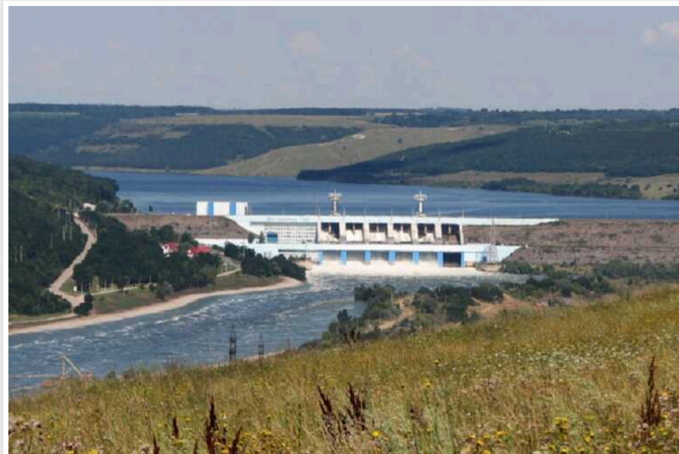
Нижньодністровська ГЕС без тендерів віддала понад 200 мільйонів гривень одній компанії

ПРАТ «Нижньодністровська ГЕС» уклало понад 100 безконкурентних угод на загальну суму 204,1 млн грн з місцевою компанією «Захід-Спецгідроенергомонтаж». Усі підряди компанія, яка належить експедитату Чернівецької облради Геннадію Ступакову, отримала в обхід конкурентних торгів.