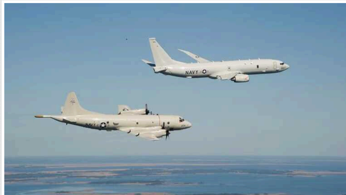
Два літаки НАТО прибули до Румунії для розвідки на кримському напрямку

Два літаки НАТО прибули до Румунії для розвідки на кримському напрямку. З цього приводу у ворожих інформаційних каналах РФ почалась хвиля занепокоєння