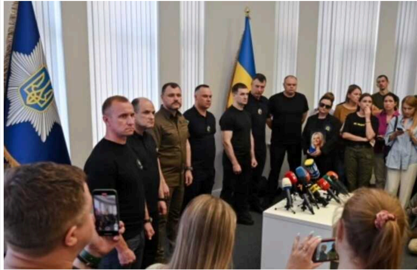
Вбивство Фаріон: поліція опитала 900 свідків та перевірила 170 камер відеоспостереження

У рамках розслідування кримінального провадження про вбивство української громадської діячки Ірини Фаріон слідчі допитали 900 свідків і призначили 22 судові експертизи.