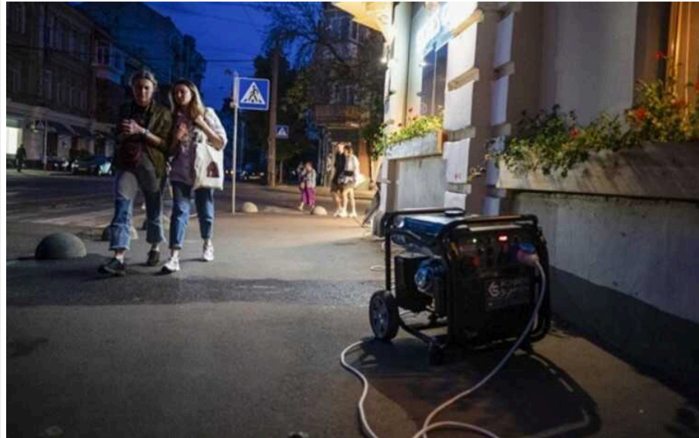
"Укренерго" оновило графіки: одна черга відключень електроенергії буде діяти до 15:00

У п'ятницю, 26 липня, одна черга відключень електроенергії буде діяти до 15:00.