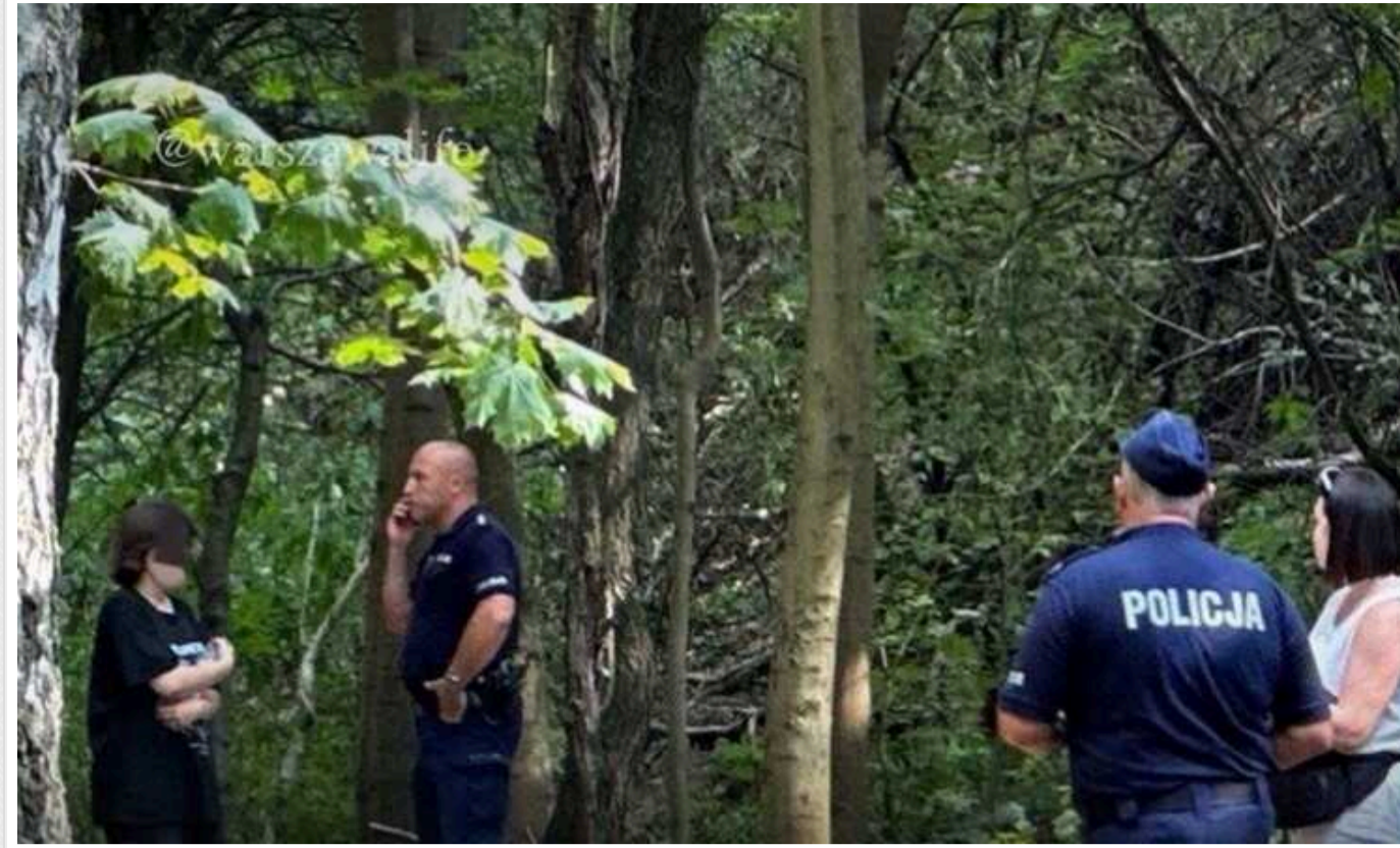
Стали відомі нові подробиці нападу іноземця на українських підлітків у Польщі

Інцидент стався 22 липня у варшавському лісі біля торгового центру Atrium Targówek.