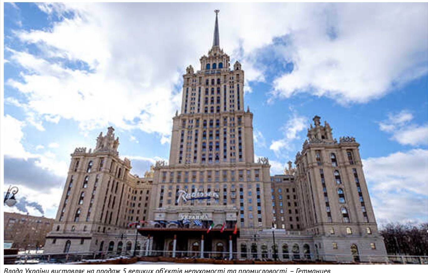
Влада України виставляє на продаж 5 великих об'єктів нерухомості та промисловості, – Гетманцев

Серед них – столичний готель "Україна", ТРЦ "Ocean Plaza" та компанії, що видобувають титан.