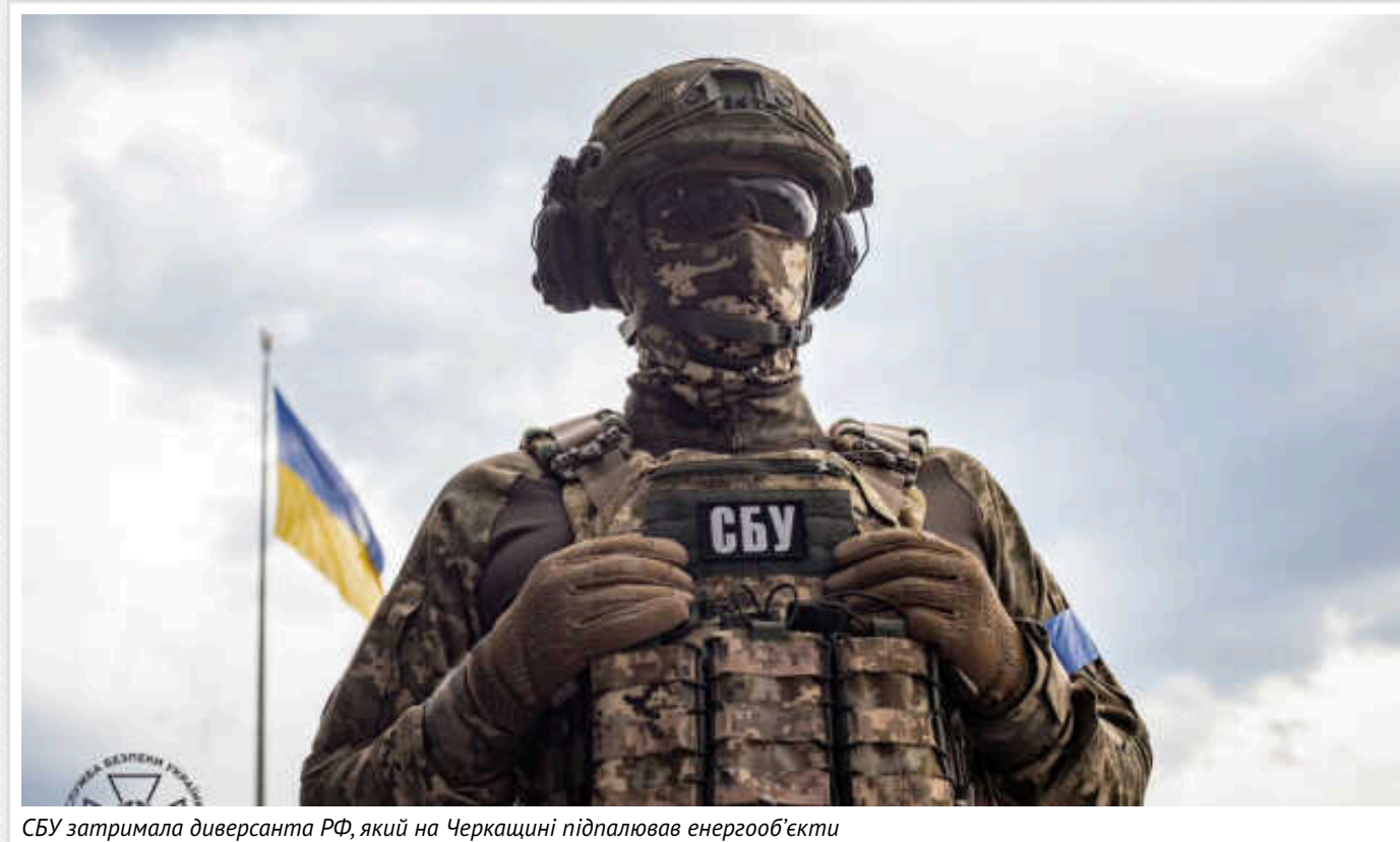
СБУ затримала диверсанта РФ, який на Черкащині підпалював енергооб'єкти

Служба безпеки України затримала диверсанта, який за завданням російської розвідки вчинив серію підпалів енергетичних об'єктів у Черкаській області.