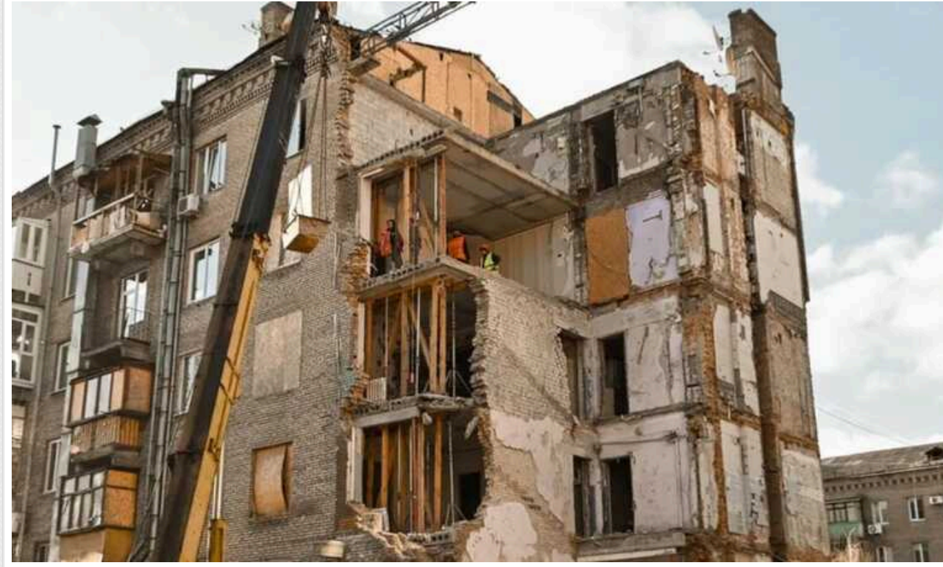
Українці можуть подати заяву в міжнародний Реєстр збитків у Гаазі

Українці з 25 липня можуть через портал "Дія" повідомити про зруйноване чи пошкоджене війною житло до міжнародного Реєстру збитків у Гаазі. Функція тепер доступна всім громадянам країни, які володіють житлом, зокрема тим, чия нерухомість розташована в окупації. Такі заявки у майбутньому дадуть право на отримання репарацій від агресора.