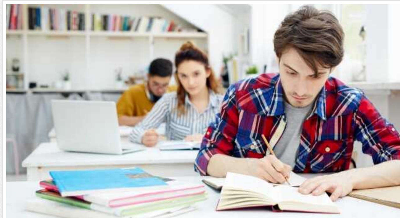
Державна регуляторна служба ухвалила скасування указу Міносвіти, який заборонив вступати на аспірантуру на контрактну денну форму

Про це йдеться у постанові регулятора №2886/20-24 від 19 липня 2024 року.