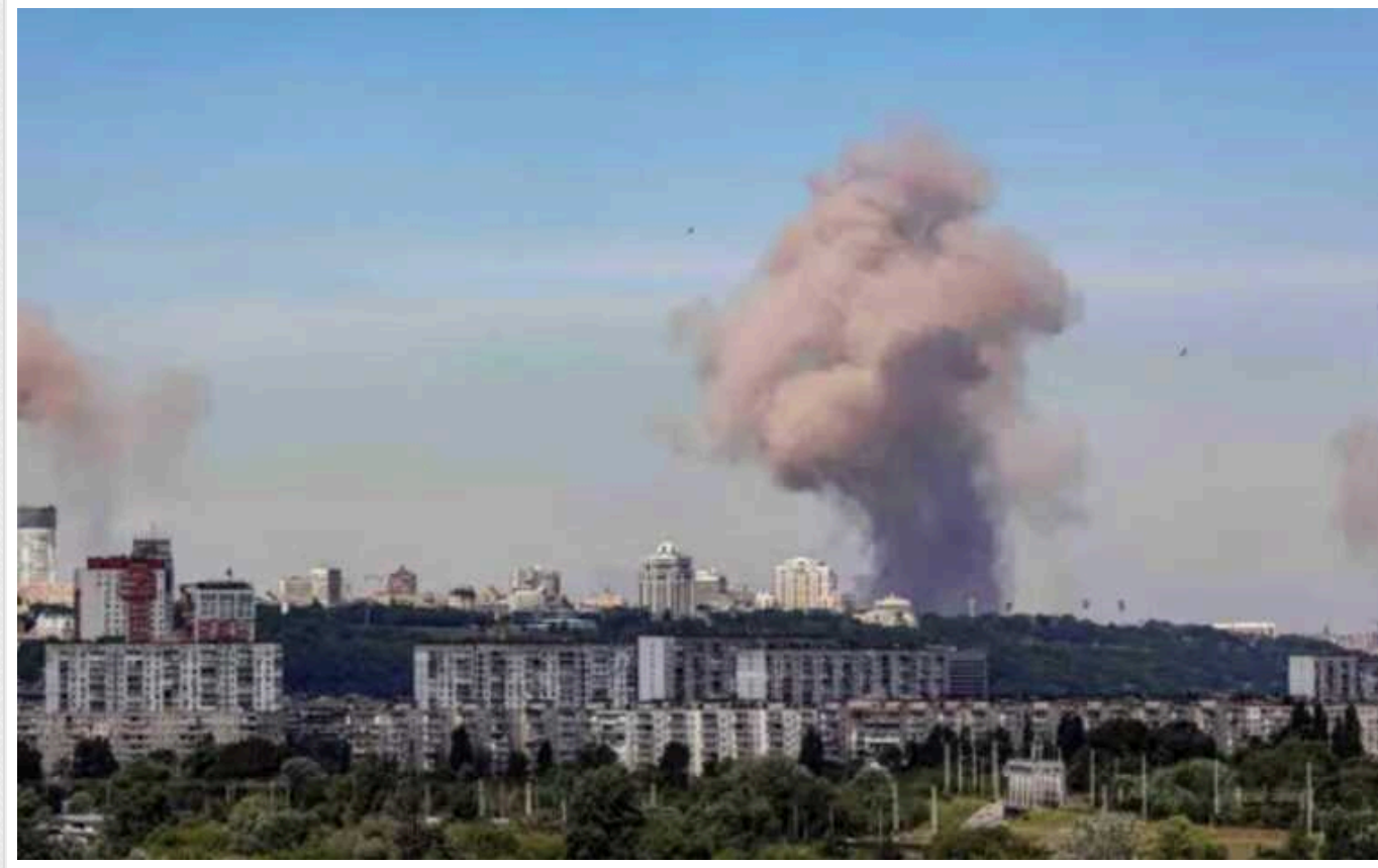
У ракеті, якою РФ вдарила по "Охматдиту", була американська мікросхема, - NYT

Крилата ракета дальнього радіуса дії X-101, якою Росія атакувала дитячу лікарню "Охматдит" в Києві, була оснащена мікросхемою з США. Йдеться про польову програмовану матрицю воріт Field Programmable Gate Array.