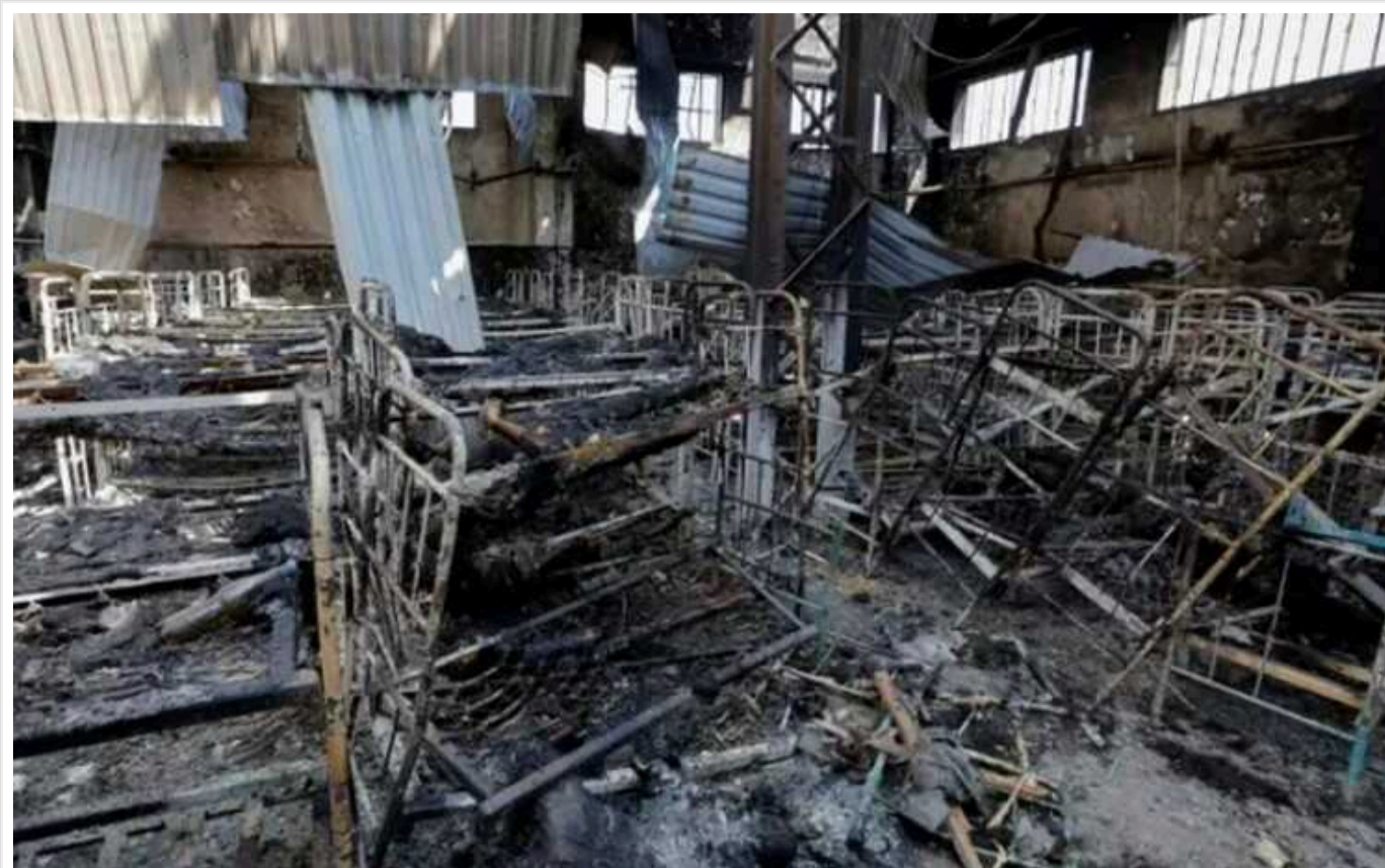
Результати розслідування теракту в Оленівці вказують на пряму вину РФ, - ЗМІ

Свідчення українських військовополонених, слідчих, родичів загиблих бійців, а також внутрішній звіт Організації об'єднаних націй вказують на Росію як на винуватця теракту в колонії в Оленівці. З моменту теракту минуло два роки – за цей час окупанти так і не пустили на територію спостерігачів ООН, а також не проводили інших незалежних експертних аналізів.