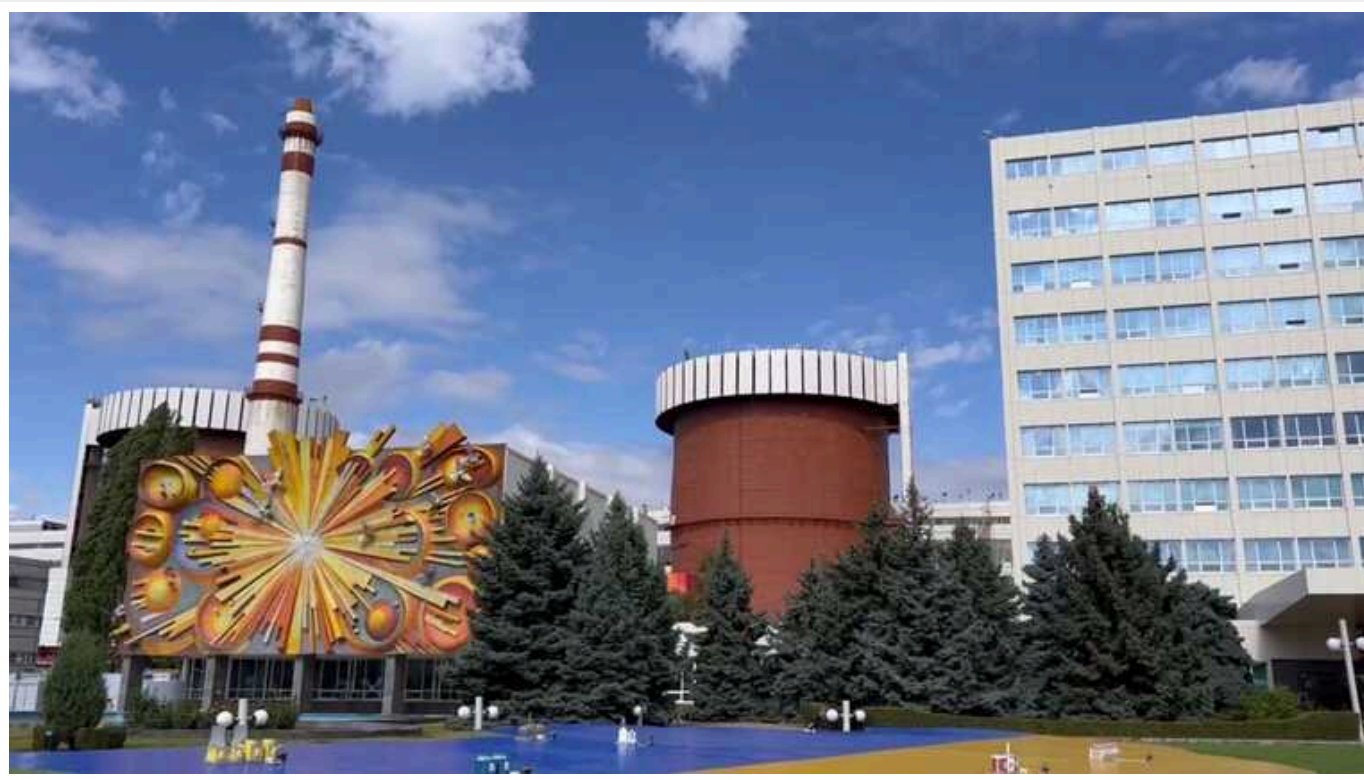
У Раді підтвердили аварію на Південноукраїнській АЕС - ЗМІ

Співрозмовники видання NV у Верховній Раді підтверджують, що в ніч на 16 липня майже пів доби не працювали реактори Південноукраїнської АЕС: вийшли з ладу два трансформатори.