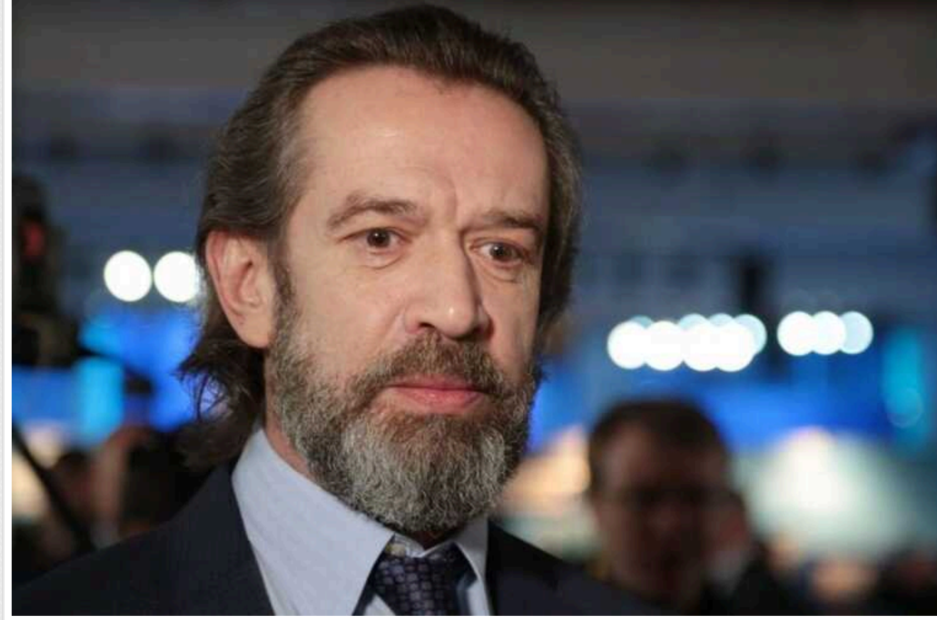
До чорного списку українського Мінкульту внесли режисера Машкова

Міністерство культури та інформаційної політики України внесло ще шістьох російських діячів культури до переліку осіб, які створюють загрозу національній безпеці країни.