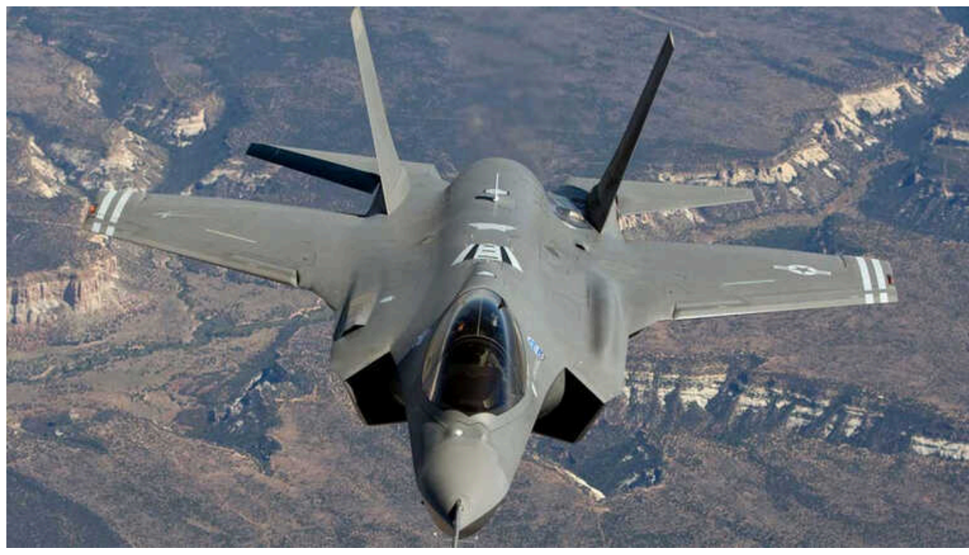
Греція підписала угоду щодо закупівлі 20 винищувачів F-35A

«Греція буде потужні збройні сили, купуючи найсучасніші бойові літаки в світі», – міністр оборони країни.