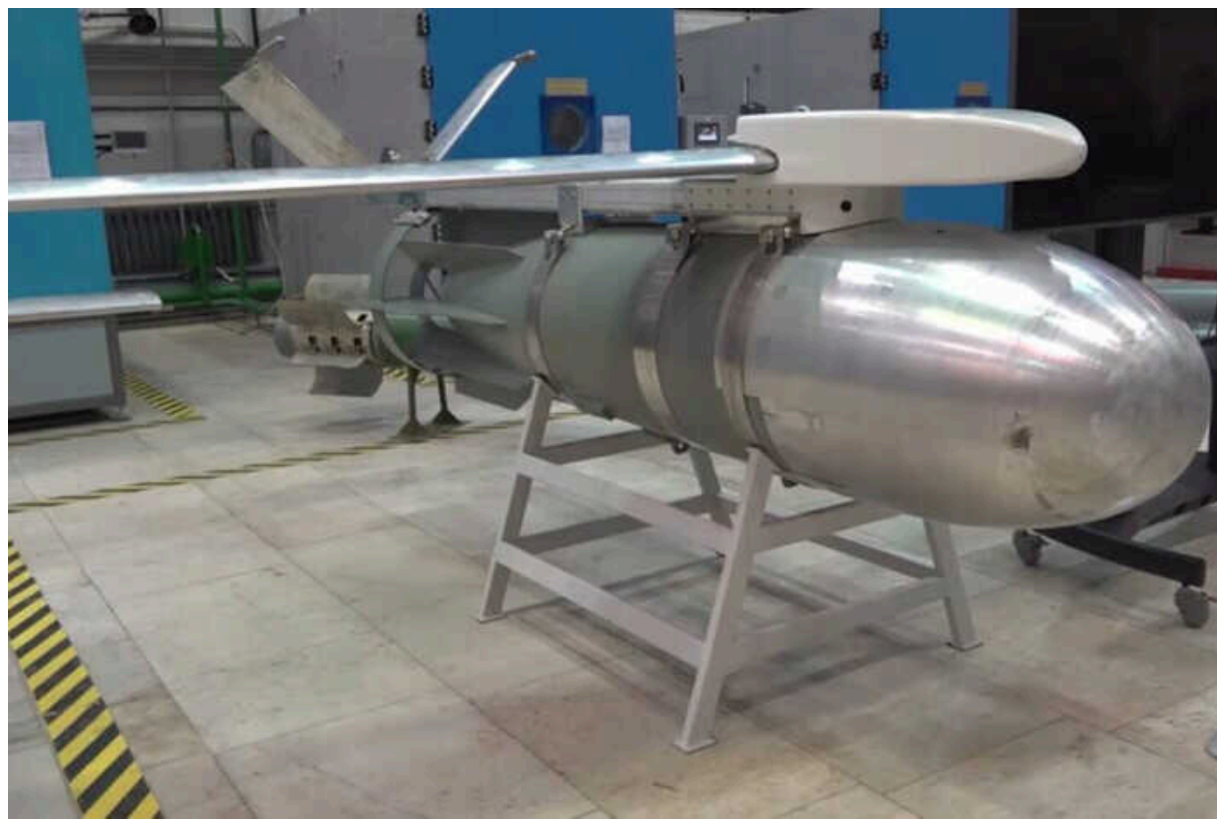
РФ вперше застосувала ФАБ-1500 по Куп'янщині

Дальність запуску ФАБ-1500 становить 50-60 км.