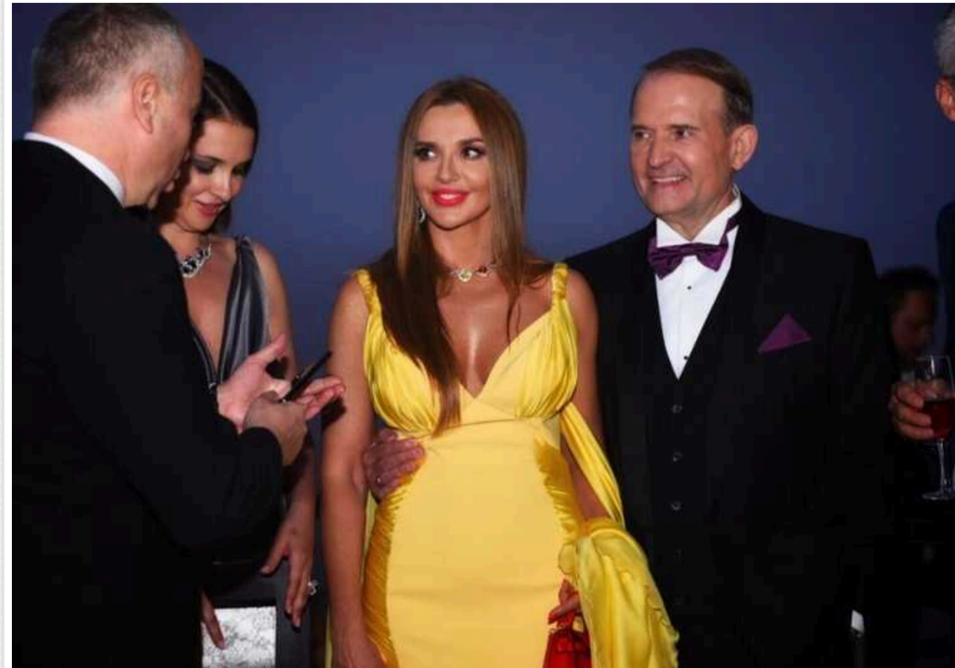
Вищий антикорупційний суд підтримав забезпечення позову до Медведчука та його дружини Марченко

Вищий антикорупційний суд наклав арешт на низку майна колишнього народного депутата від забороненої партії «Опозиційна платформа - За життя» Віктора Медведчука та його дружини Оксани Марченко як забезпечення позову про його конфіскацію.