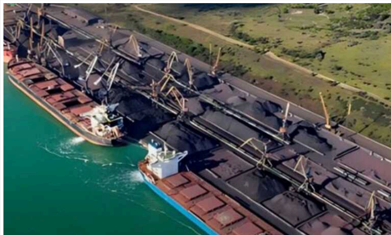
НАБУ й САП скерували до суду справу за обвинуваченням ексміністра інфраструктури України Пивоварського та його першого заступника

НАБУ й САП скерували до суду справу за обвинуваченням колишніх міністра інфраструктури України та його першого заступника у завданні державі збитків на понад 49 мільйонів доларів.