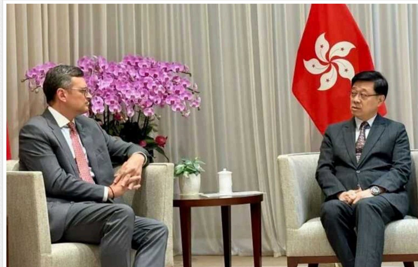
Глава МЗС України відвідав Гонконг: закликав закрити РФ шляхи для обходу санкцій

Сьогодні, 25 липня, в рамках візиту до Китаю, глава Міністерства закордонних справ (МЗС) Дмитро Кулеба відвідав Гонконг.